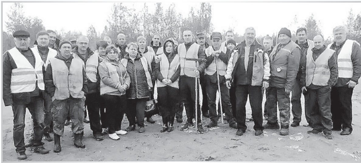
На субботнике. 2017 г.

ные выезды. Позднее, когда фото уже стали цветными, выездов стало значительно меньше — коллектив собирался по праздникам тесным кругом на родном предприятии. Самые свежие снимки показывают процессы дорожного строительства, расширение дорог, новые единицы техники. А вот и самая свежая общая фотография с субботника! Такие же субботники организовывались коллективом и 20, и 30 лет назад.