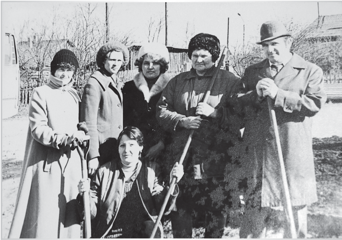
На субботнике. 1984 г.

в Павлово, не справляется с объемом работ, дополнительно направляется автотранспорт из Синявино.