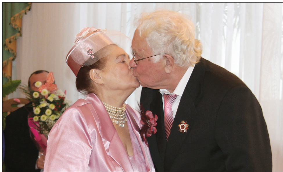
Свадебный поцелуй бриллиантовых юбиляров