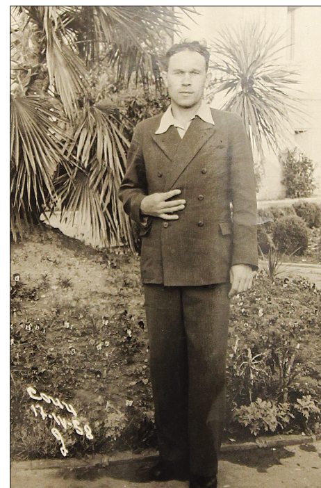
Василий Яковлевич в 1958 году