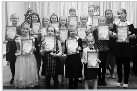
Отделение общего эстетического образования

Для конкурсантов отделения общего курса фортепиано не является основным инструментом. Несмотря на это, их выступления были яркими, эмоциональными и осмысленными. Каждый участник был награжден дипломом и памятным кубком. Хочется верить, что для юных музыкан-