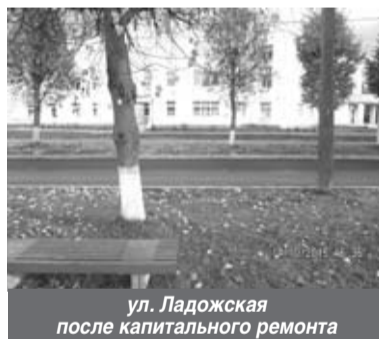
ул. Ладожская после капитального ремонта

в которых участвовали ранее. Но в этом году нам все-таки придется затянуть пояса. Большая часть средств у нас будет заложена на культуру - это 94 млн. рублей, в эту сумму также включен и капитальный ремонт ДК. По статье Жилищно-коммунальное хозяйство мы планируем 65 млн. рублей, это и капитальный ремонт МКД, содержание и восстановление ливневой канализации, строительство газопровода по ул. Набережная. Что касается национальной политики, куда входит контракт на благоустройство (ямочный ремонт, уборка улиц, содержание внутридворовых проездов), ремонт тротуаров, дорог, проездов, мы закладываем почти 50 млн. рублей. Но точные суммы будут известны уже после официального принятия бюджета советом депутатов МО "Кировск" 11 ноября. Также не стоит забывать, что на публичных слушаниях по бюджету мы учитываем предложения и замечания жителей и вносим изменения в проект бюджета. И жители должны принимать самое активное участие в формировании главного финансового документа города, потому что бюджет формируется с учетом их мнений.