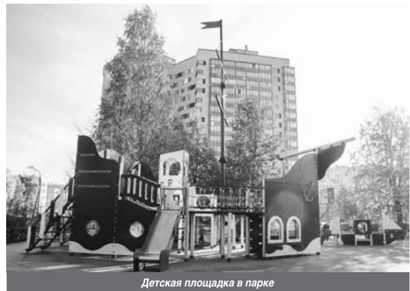
Детская площадка в парке

- Мы все знаем, что у нас в стране кризис и, к сожалению, бюджет на 2016 год будет достаточно тяжелый. Сейчас мы по максимуму стараемся заложить в бюджет все те областные программы,