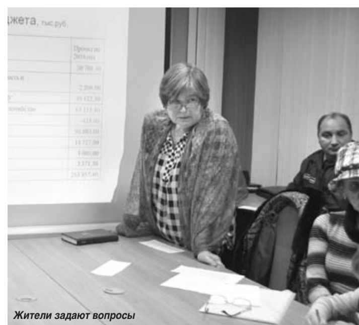
Жители задают вопросы