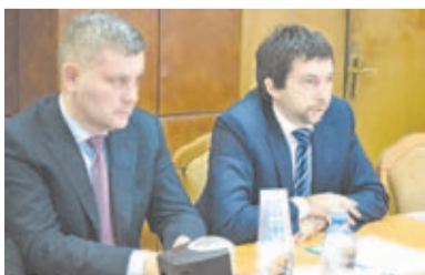
Руководители ООО Эм-Си Баухеми