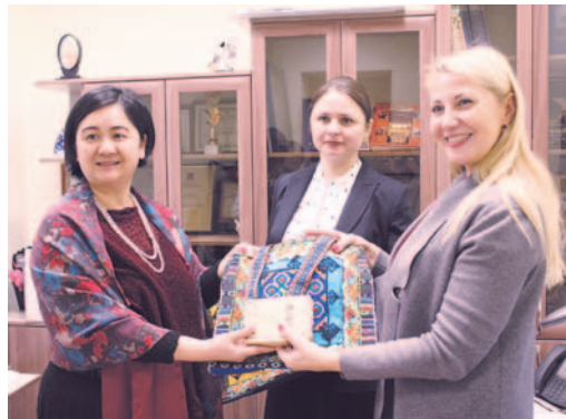
Пресс-служба администрации МО «Кировск»

Китайские друзья посетили репетицию циркового коллектива, а также ознакомились с портфолио других заслуженных коллективов Дома культуры. Гостями был отмечен высокий уровень подготовки наших артистов.