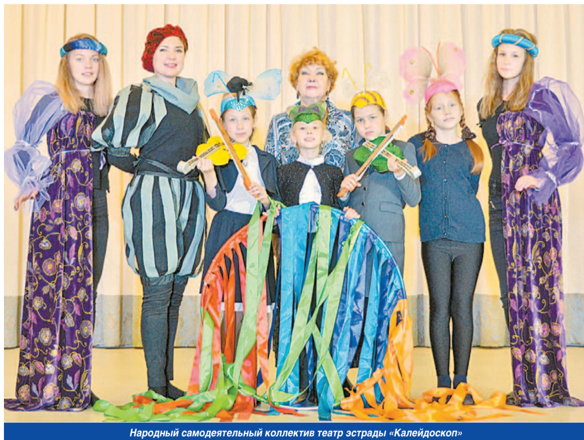
Народный самодеятельный коллектив театр эстрады «Калейдоскоп»

— Спасибо за такой развернутый ответ — практически экскурс в жизнь Дома культуры. Получается, что проблем с наполняемостью кружков у вас нет?