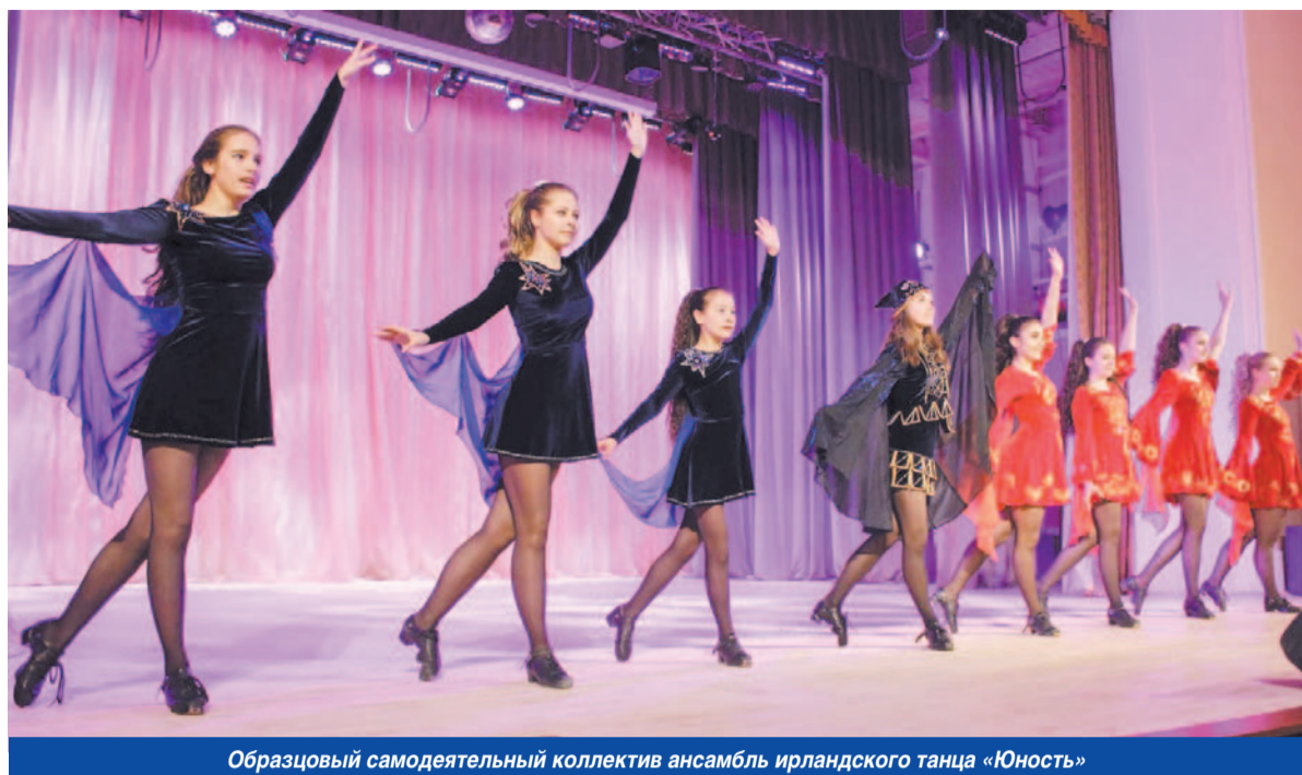
Образцовый самодеятельный коллектив ансамбль ирландского танца «Юность»

специальная обувь, уникальные костюмы, хореография... При ансамбле создан младший коллектив «Ириски», где занимаются дети с четырех лет. Поначалу они осваивают азы хореографии, а уже потом переходят к изучению традиций ирландского танца. На протяжении четырнадцати лет каждое лето ансамбль выезжает с выступлениями в различные города России, Украины, Болгарии, Румынии, Германии, Австрии, Чехии, Франции и Италии.