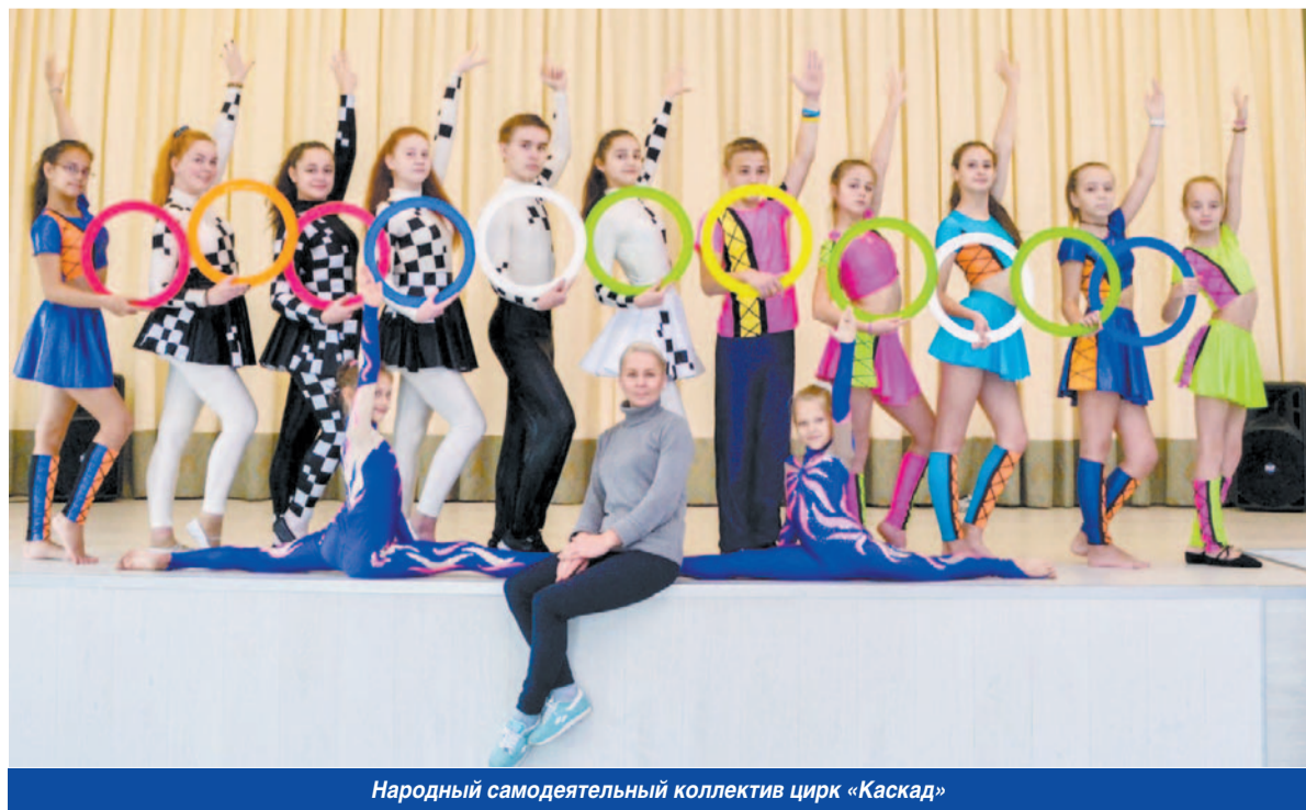
Народный самодеятельный коллектив цирк «Каскад»