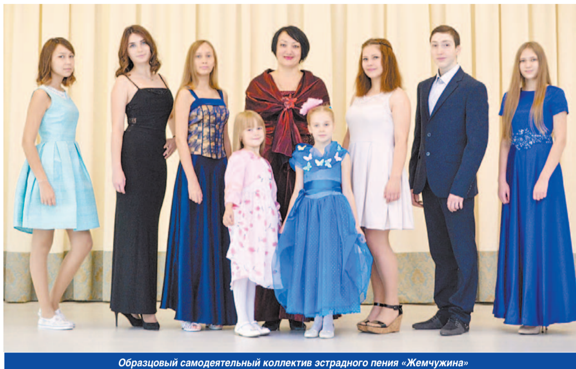
Образцовый самодеятельный коллектив эстрадного пения «Жемчужина»

— Да, одна реликвия, пережив вместе с нами ремонты и переезды, вернулась домой. Наверное, многие, особенно