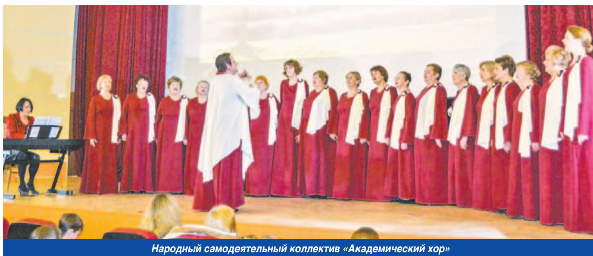
Народный самодеятельный коллектив «Академический хор»