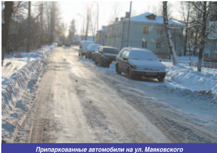
Припаркованные автомобили на ул. Маяковского