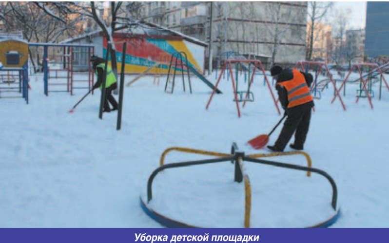
Уборка детской площадки