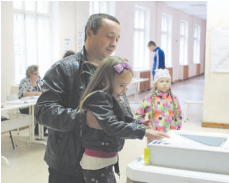
Распределение голосов избирателей округа №16