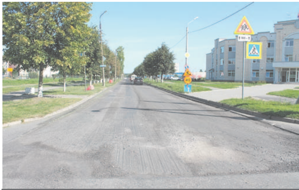
Ремонт ул. Ладожской

Отремонтированы участки дороги по ул. Энергетиков (возле детского сада), ул. Новой (возле школы № 1)