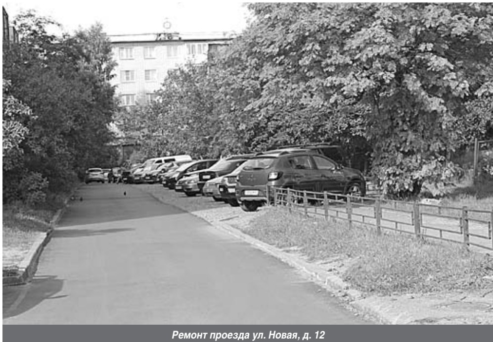
Ремонт проезда ул. Новая, д. 12