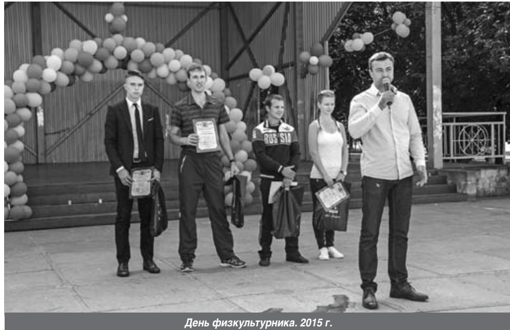
День физкультурника. 2015 г.

- По возможности я, конечно, стараюсь посещать все городские мероприятия. Пару недель назад присутствовал на праздновании Дня физкультурника в ПККО. Праздник спорта получился очень насыщенным и разнообразным. Я испытываю чувство большого уважения и гордости за спортивную молодежь Кировского района, которая так умело демонстрировала свои таланты и навыки. Удалось посетить празднование Дня семьи, любви и