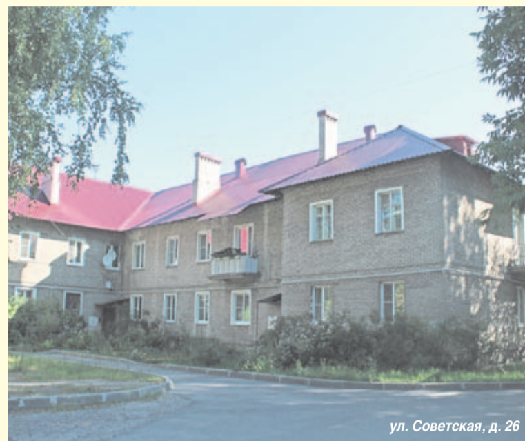
ул. Советская, д. 26

В 2015 году в Кировске продолжились работы по Региональной программе капитального ремонта общего имущества в многоквартирных домах, расположенных на территории Ленинградской области на 2014-2043 годы.