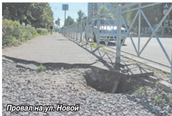
Провал на ул. Новой