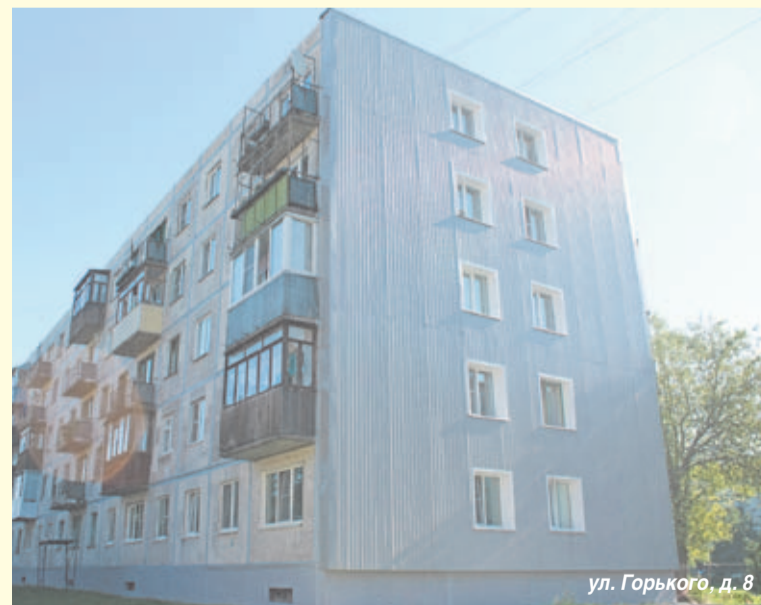
ул. Горького, д. 8

По ул. Горького д. 8 проведены следующие работы: восстановление герметизации межпанельных швов, ремонт цоколя, утепление торцевых стен современными материалами. В августе будут начаты работы по ремонту крыши.