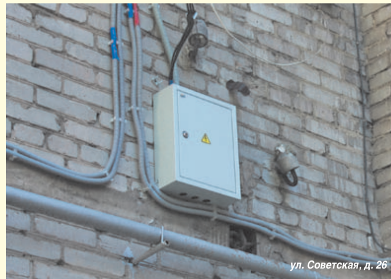
ул. Советская, д. 26

На сегодняшний день произведен ремонт крыши, ремонт внутридомовых сетей электроснабжения от ввода в здание до ввода в квартиры по ул. Комсомольской д. 9, ул. Победы д. 23 и ул. Советской д. 26.