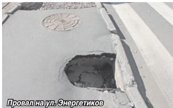
Провал на ул. Энергетиков

В связи с возникшей проблемой «Водоканалу» пришлось проводить работы по горизонтально-наклонному бурению по ул. Энергетиков (возле детского сада) и ул. Новой (возле школы №1). После проведения работ канализация начала нормально функционировать, однако после ремонтных работ «Водоканал» не привел в надлежащее