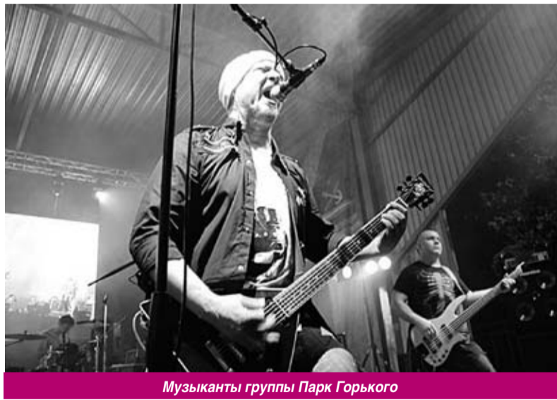
Музыканты группы Парк Горького