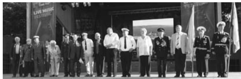
Чествование ветеранов ВМФ