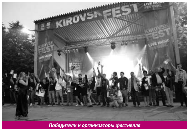
Победители и организаторы фестиваля