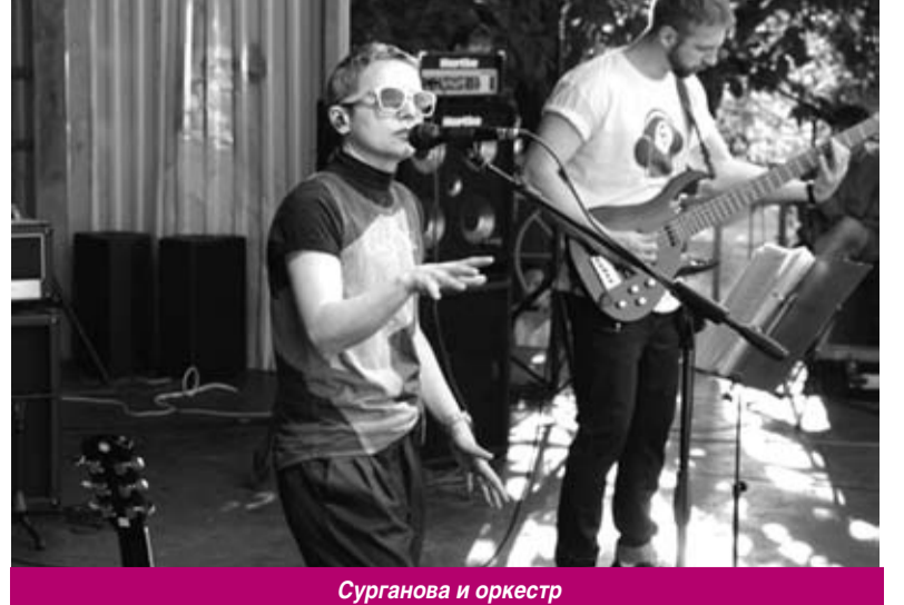
Сурганова и оркестр