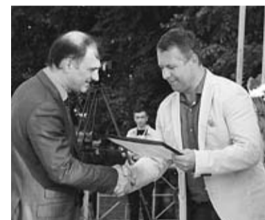
Вручение Благодарности ООО СпецГазЭнергоМаш