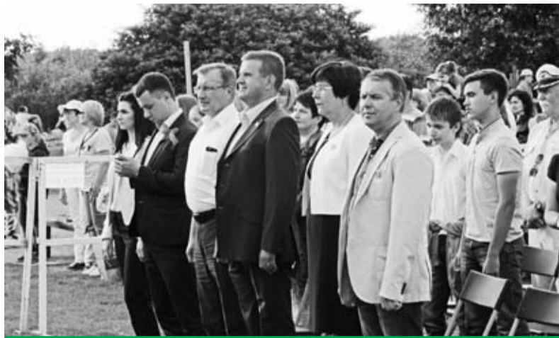
Играет Гимн Ленинградской области

В торжественной обстановке стройной колонной ветераны морфлота поднялись на Кировскую сцену, чтобы получить по-