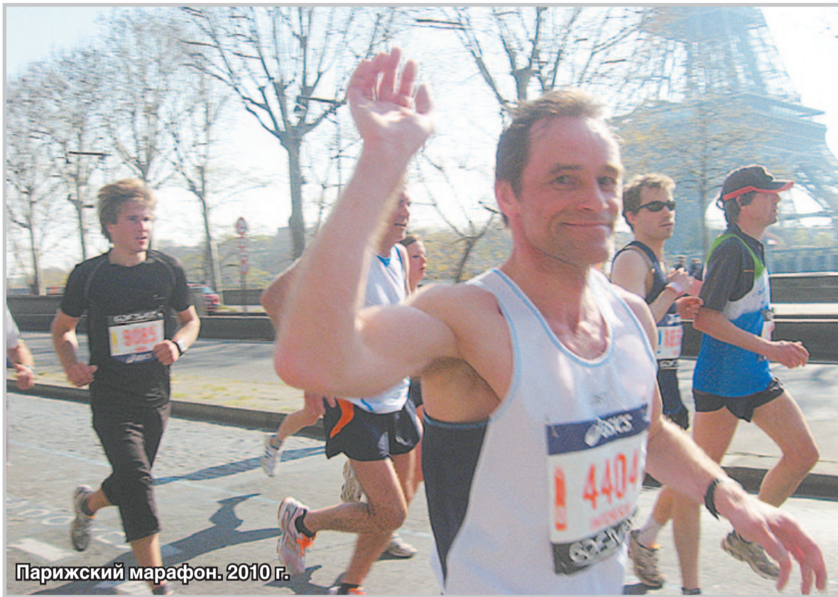
Парижский марафон. 2010 г.