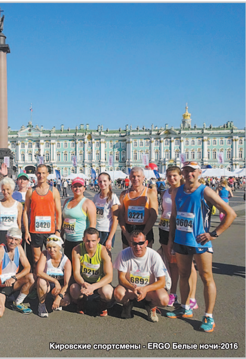
Кировские спортсмены - ERGO Белые ночи-2016