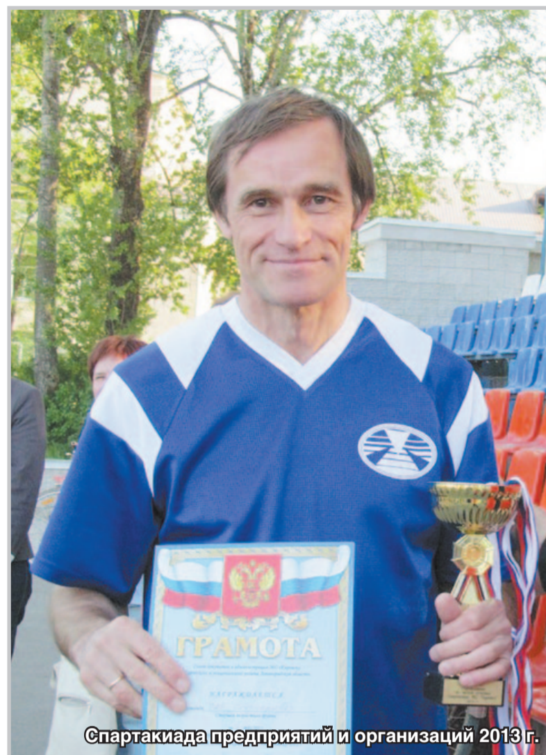
Спартакиада предприятий и организаций 2013 г.

«Коньковый шаг мне давался тяжело, и там, где в классике я обычно приходил первым, теперь приходилось довольствоваться более скромными успехами. Да и вообще сам одновременный ход мне не подходил. На какой-то период я полностью