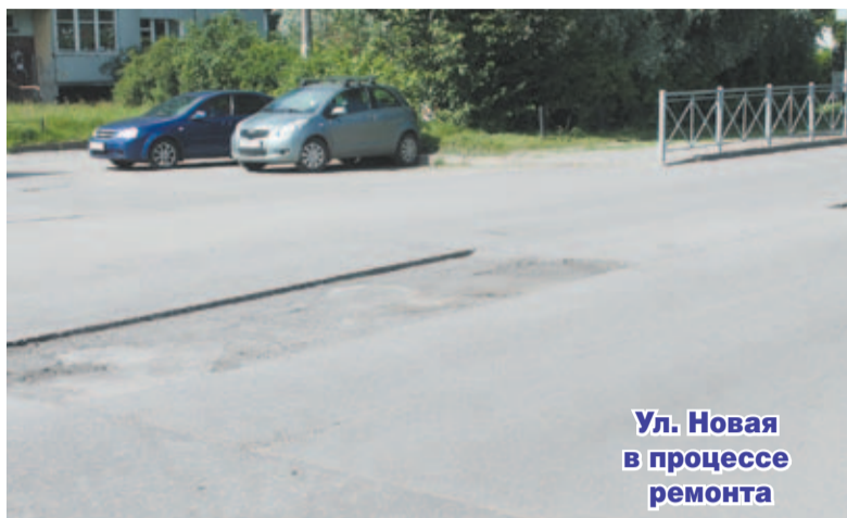
Ул. Новая в процессе ремонта