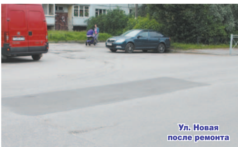
Ул. Новая после ремонта