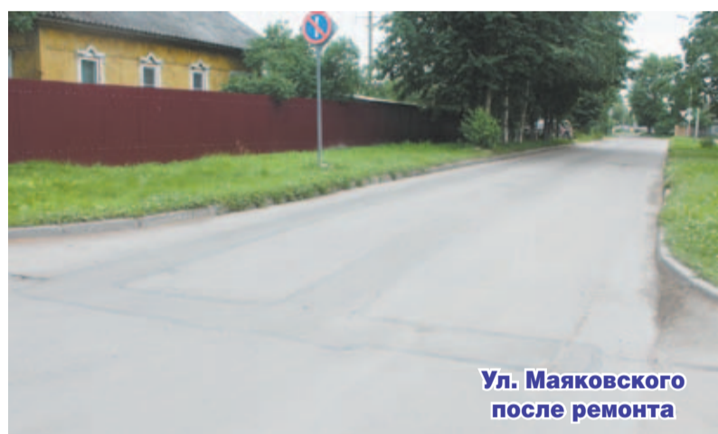
Ул. Маяковского после ремонта