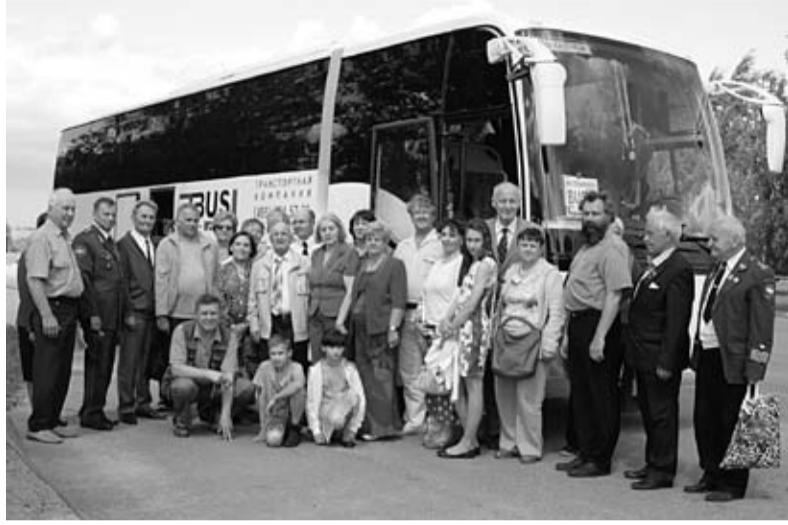
Делегация тверского землячества

Посещение этого города не входило ни в один из моих личных или семейных планов. Все произошло спонтанно, но сейчас мне кажется, что решение было единственно верным.