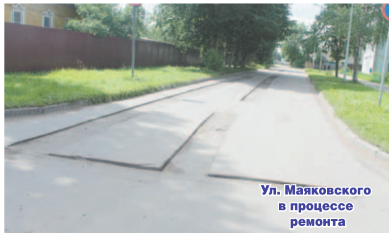
Ул. Маяковского в процессе ремонта

так и подрядным способом. Часть дорожных работ в этом году «БОСТ» выполнил силами своих специалистов, а к восстановлению дорожного покрытия основных улиц города привлекли подрядчиков. Ямочный ремонт улиц Новой, БПС, Маяковской и Советской проводила специализированная подрядная организация - победитель в аукционе в электронной форме. Ремонт был выполнен в достаточно короткие сроки, однако погода вносила свои коррективы. Из-за дождей не раз переносилась проливка швов, её произвели буквально пару дней назад. В течение недели МБУ «БОСТ» проведет проверку качества ремонта, выполненного подрядной организацией. На данном этапе видно, что использование подрядного метода имеет высокую эффективность и экономическую целесообразность. Привлечение специалистов узкого профиля положительно сказывается на качестве работ, поэтому в дальнейшем планируется привлекать подрядчиков и к другим видам работ, к примеру, прочистке ливневой канализации. Прочистка сетей ливневой канализации проводится гидродинамическим способом, что требует специального оборудования.