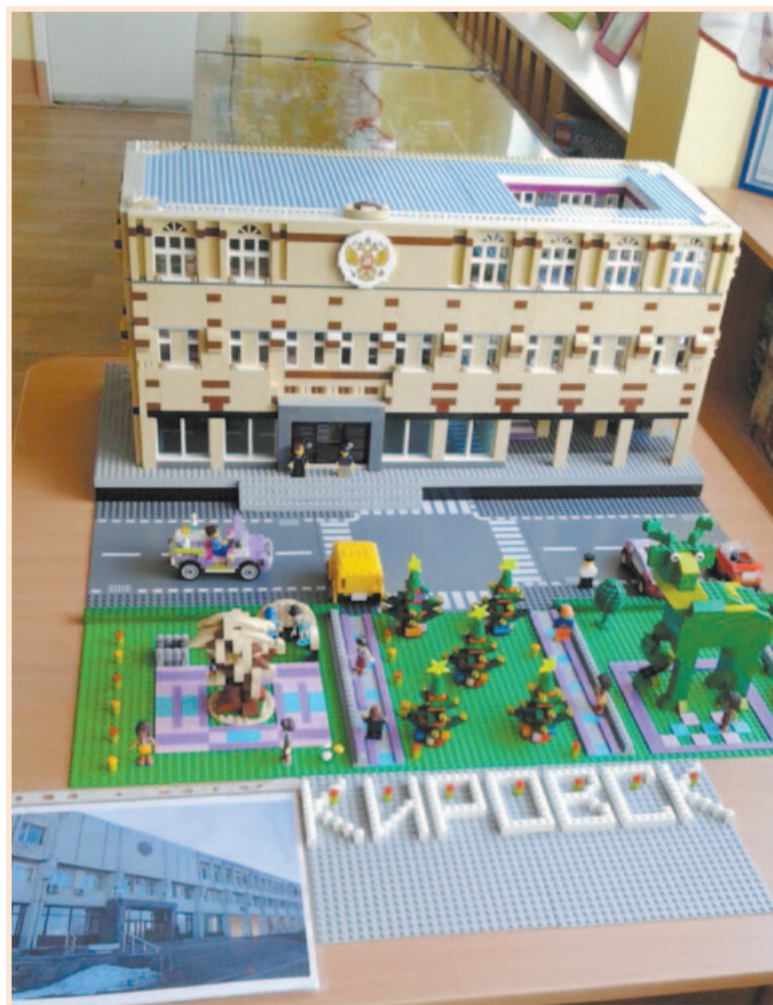
«Кировский район — сердце Ленинградской области», 2017 год. LEGO-макет «Центральная площадь города Кировска»

Макет представляет здание администрации района и прилегающие к нему территории. Из достопримечательностей зритель увидит символ района — лосенка Кириюшу и Дерево желаний. Все детали подобраны с удивительной точностью, сохранена цветовая гамма, также площадь украшает надпись «Кировск».