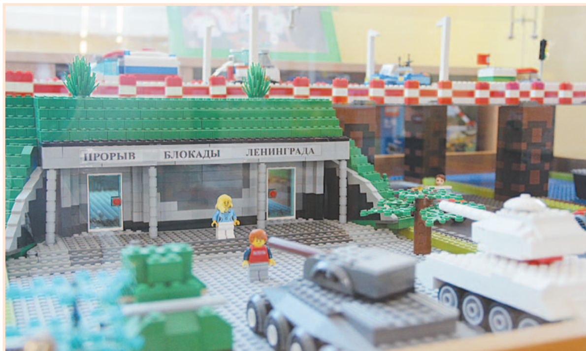
«Край, в котором мы живем», 2013 год. LEGO-макет «Прорыв блокады Ленинграда»

Был создан к 70-летию прорыва блокадного кольца. Неудивительно, что именно к музею, посвященному этому событию, был обращен взор руководства детского сада и студии конструирования. Доминантой макета является здание музея-диорамы, также создана танковая экспозиция, расположенная на преддиорамной площади, и Ладужский мост.