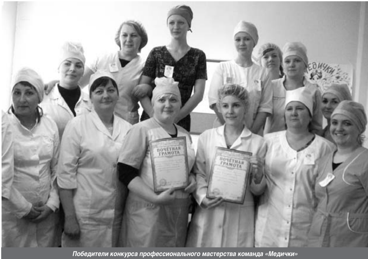
Победители конкурса профессионального мастерства команда «Медички»

На страницах «Недели нашего города» мы неоднократно освещали темы образования, в том числе среднего профессионального. В этот раз мы хотели бы познакомить вас с учреждением образования, которое уже 19 лет существует в Кировске, но о котором мало кто знает.