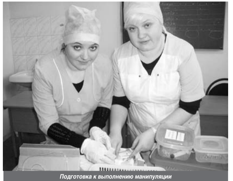
Подготовка к выполнению манипуляции

В скором времени мы переезжаем в Шлиссельбург. Новое руководство больницы выделило нам помещения под лекционные залы, сейчас там идет ремонт. Из плюсов нашего переезда можно назвать обширную практическую базу - в Шлиссельбурге ведь теперь располагаются и травматология, и гинекология, и хирургия... Конечно переезды - это лишние хлопоты, но всегда лучше иметь собственный угол. За эти годы где мы только ни занимались: и в подвальных помещениях, и в бывшем «красном уголке», сейчас аудитории тоже небольшие. Будем обживать на новом месте, может и группы сможем набирать больше. Год от года набор может быть разным. Раньше, знаю, группы бывали и маленькие - человек 14-17, а в больнице оставались работать только 3-4 медсестры, остальные уезжали в Санкт-Петербург. Сейчас группы больше - от 20 человек. И, самое главное, 80% выпуска 2016 г. остается работать у нас в больнице.