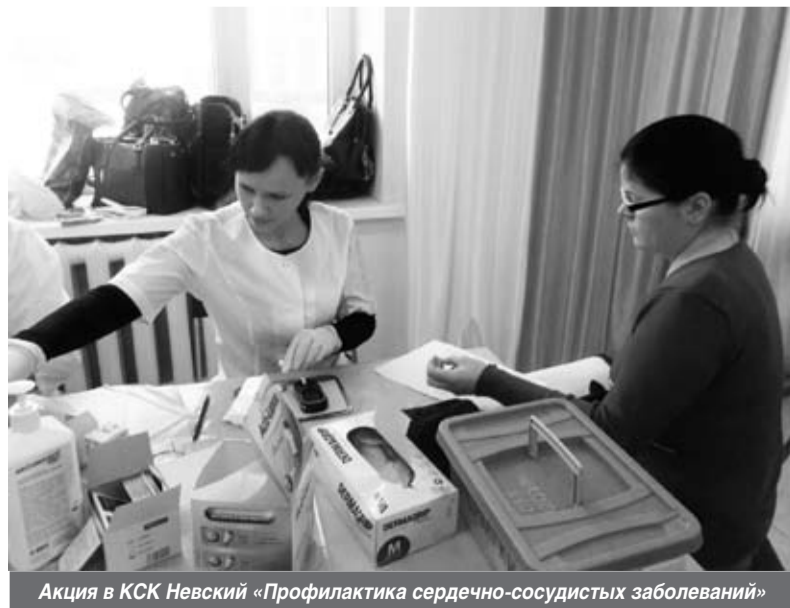
Акция в КСК Невский «Профилактика сердечно-сосудистых заболеваний»

Н.В.: Конечно, это в основном женщины. Если говорить о возрасте, то возраст разный. К нам