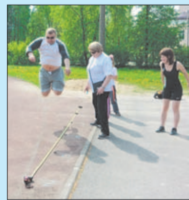
ПАПА, МАМА, Я