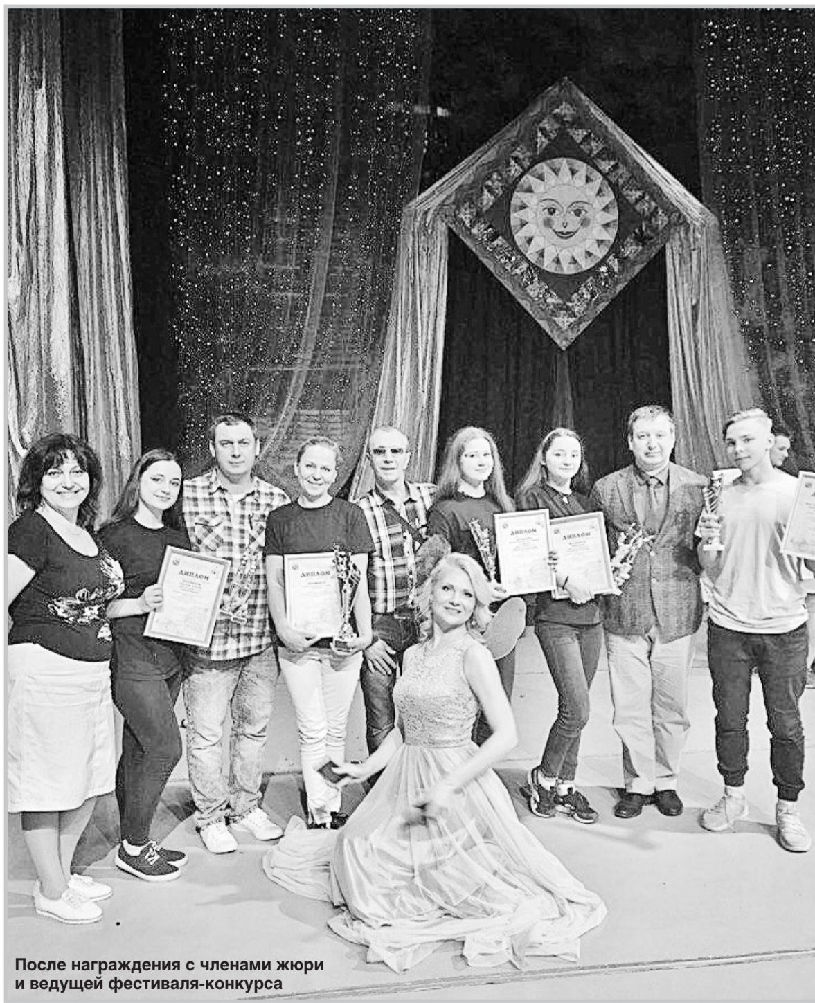
После награждения с членами жюри и ведущей фестиваля-конкурса