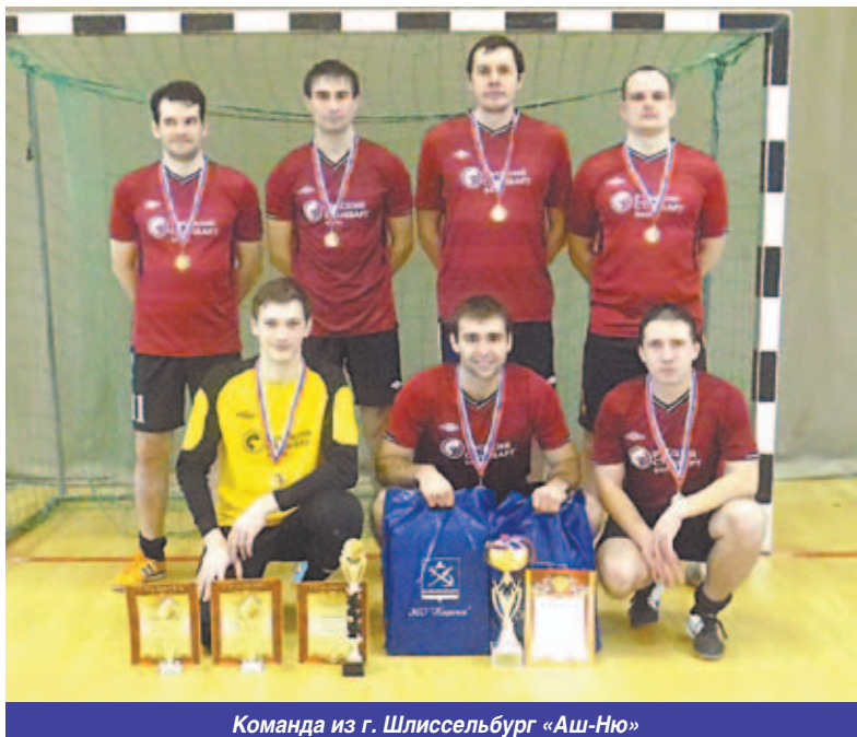
Команда из г. Шлиссельбург «Аш-Ню»

ные сладкие призы для победителей и участников соревнований.