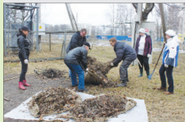
Коллектив администрации МО КГП