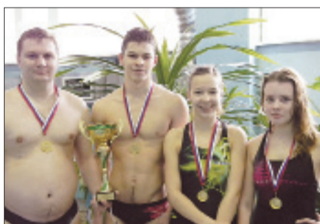
Команда г. Кировска