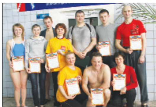
Победители личных соревнований

■ Совершать заплывы в близлежащих водоемах еще рановато. Весна, конечно, пришла в наш город, но, увы, пока не такая теплая, как нам бы хотелось. Зато бассейн Кировска гостеприимно принимает всех опытных и начинающих пловцов. Так, 22 апреля, в большой ванне бассейна прошли соревнования по плаванию в рамках городской спартакиады.