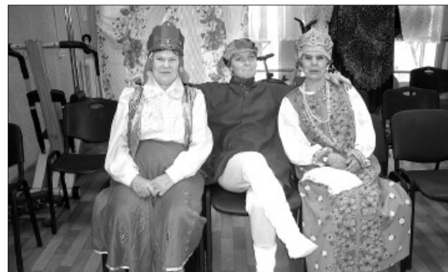
Участники Ансамбля «Задоринка»

– Репертуар у нас очень разнообразный. Мы начинали с военно-патриотических песен, так как вскоре после образования ансамбля близился День Победы. Поэтому коллектив готовился основательно. Потом, безусловно, пели произведения фольклора. Народные песни замечательно воспринимаются, легко разучиваются. Их можно прекрасно обыграть, устроить из песни настоя-