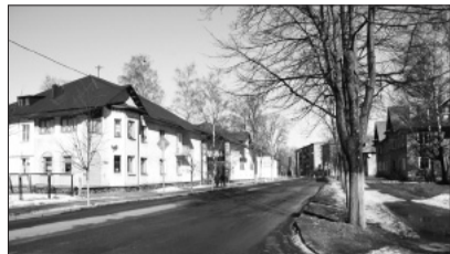
г. Кировск, ул. Краснофлотская

Весна всего лишь время года. Хотя для людей она на протяжении многих веков остаётся загадкой. Весенние дни, действительно, необычны. С одной стороны – это оживление, пробуждение природы и жизненных сил, положительные эмоции и приятные волнения, а с другой – слабость, плохое настроение, усталость и раздражительность.