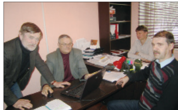
Руководство ООО «Конста Л. А.»

договорились с наиболее крупными действующими в Кировске управляющими компаниями (ООО «Гарант-Сервис» и ООО «Жилком») о том, что в случае перехода к ним под управление домов от «Консты», они примут к себе на работу и работников «Консты» с тем, чтобы они могли продолжить свою работу по обслуживанию тех же домов. Это