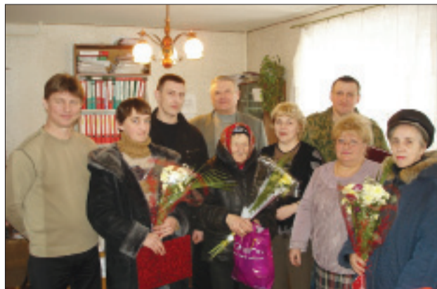
Коллектив ООО «Конста Л. А.»