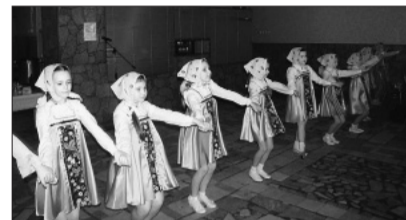
Коллектив МУП «РДК»