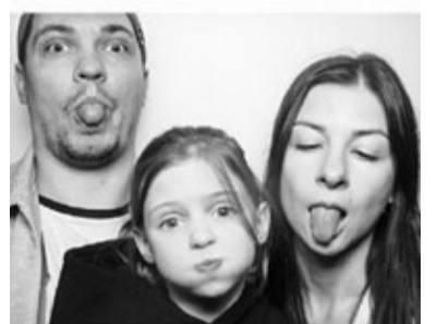
С женой и дочкой

чинаются детские игры в семью с участием мальчиков. Я как отец не могу к этому спокойно относиться. Полушута уже говорю, что подыскиваю для дочери моностирь. А она мне заявляет, что целовалась в школе с каким-то Пашей/Мишей/Сашей! Я, конечно, при дочери сдерживаюсь, но внутри вскипаю, как адский котел. Вместе с тем, я прекрасно понимаю, что ребенок считывает поведение взрослых, родительские отношения. И я хочу, чтобы мнение всех учитывалось равноценно. Самая главная цель в жизни, это чтобы мой ребенок был счастлив. Большого не надо.