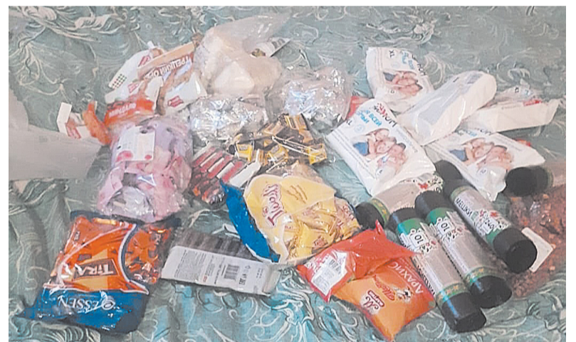
Совет ветеранов МО «Кировск» принял активное участие в сборе посылки для ребят в госпиталь. Спасибо за участие

Благотворительный фонд «Шаман» в своем телеграм-канале поделился историей одного ростовского госпиталя, с которым у