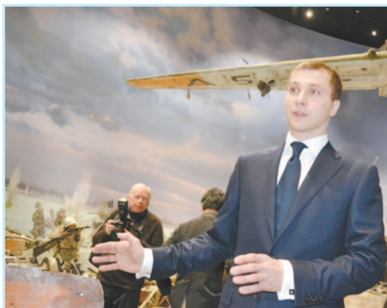
После осмотра основной экспозиции музея Владимир Владимирович провел встречу с представителями молодежных организаций, ветеранами и создателями фильма «Рубеж».

Присутствовавшим были показаны эпизоды нового российского художественного фильма, основой сюжета которого стало загадочное перемещение успешного молодого человека в 1941 год на легендарный Невский пятачок. Именно там в гущу кровопролитных событий главный герой начинает понимать ценность каждой человеческой жизни. Авторы фильма сообщили, что на экраны «Рубеж» выйдет в феврале текущего года.