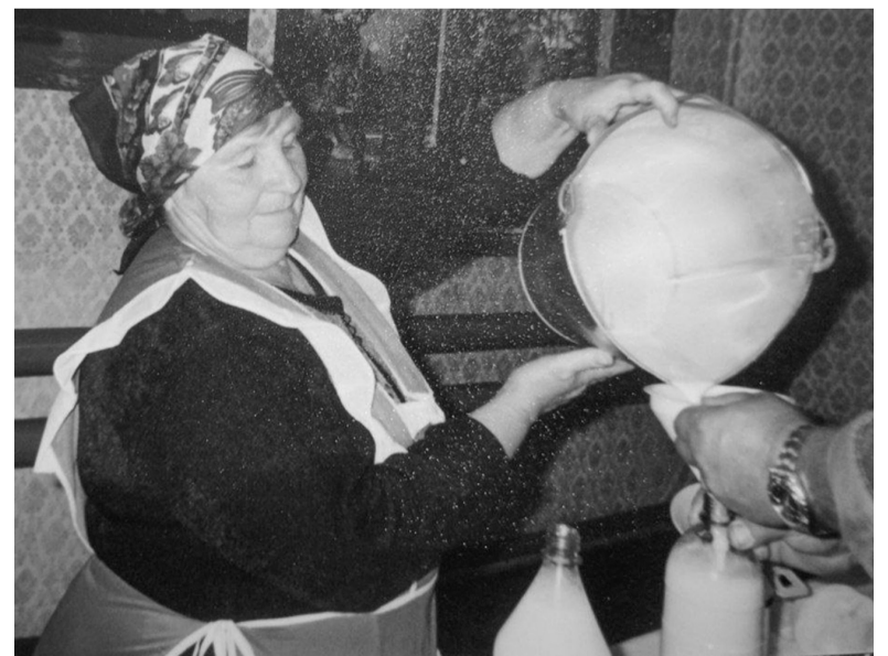
Совхозный магазин в п. Молодцово, продажа молочной продукции