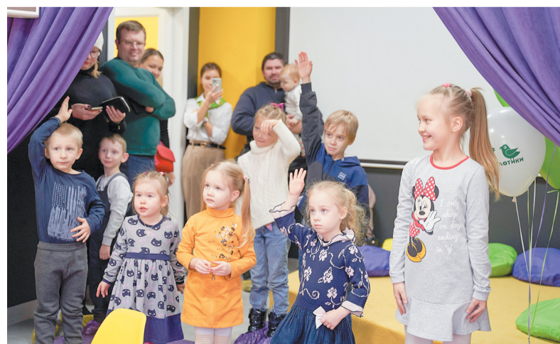
Открытие студии 2020 г.