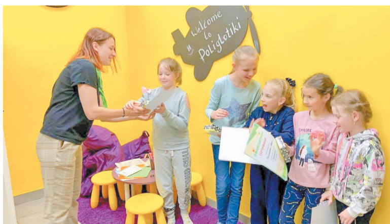
За успехи в учебе