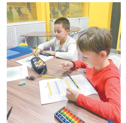
Тренируем устный счет

— Ежегодно подтверждаем статус социального предприятия и получаем поддержку от государства. Недавно, пройдя обучение в рамках мероприятий для поддержки субъектов малого предпринимательства, мы защитили проект и получили грант, который помог оснастить наш центр новой техникой для расширения спектра услуг и улучшения качества (например, интерактивная доска, синтезатор для вокальной студии, печь для кулинарного курса).