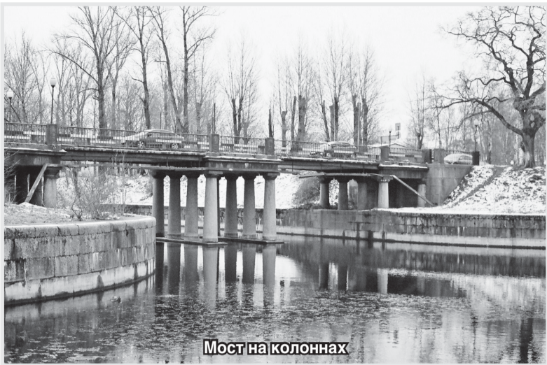
Мост на колоннах

выше глубины канала), что можно было сделать, только спустив воду из резервуаров, которые образовались по всей низменной местности за левой дамбой. В описании, сделанном Минихом до этого, не говорилось, что он собирался питать канал искусственными водами, однако случай с яхтой дал повод обратить внимание на воду, которая скапливалась за дамбой, и превратить ее в искусственные резервуары для питания канала водой при необходимости.