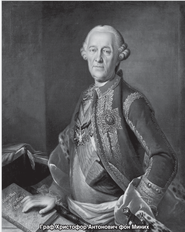
Граф Христофор Антонович фон Миних

Дело было сложным. В пустынной, слабозаселенной местности нужно было собрать значительное количество рабочих, обеспечить их жильем, инструментами и продовольствием. Расходы предстояли немалые! Для их покрытия пришлось установить особый налог — 5 копеек с рубля капитала. Чтобы выдержать установленный срок окончания строительства, наемных работников должно было быть не менее двадцати пяти тысяч, и в 1721