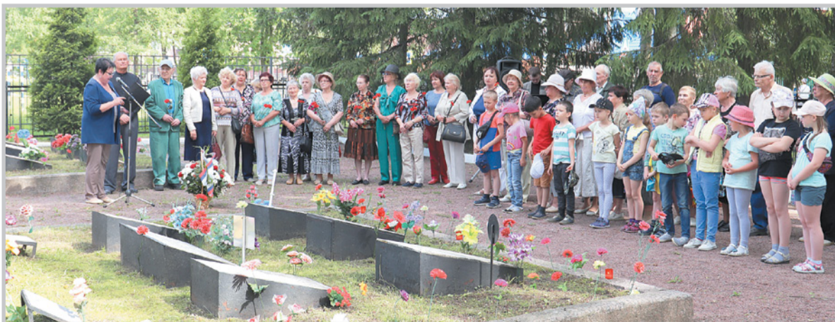
Пресс-служба администрации МО «Кировск»