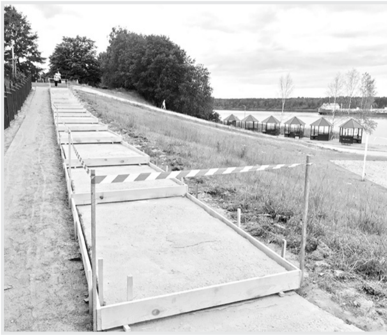
Согласно муниципальному контракту гарантийный срок работ составляет три года с момента подписания актов об их

16 апреля в администрации МО «Кировск» прошло совещание с подрядчиком ООО «Дорожно-строительная компания» по вопросу устранения дефектов благоустройства в районе зоны отдыха у воды, выявленных после осенне-зимнего периода. В этот же день состоялось повторное обследование данной территории вместе с депутатским корпусом, представителями подрядчика и СМИ. В ходе совещания были рассмотрены пункты контракта и технического задания, оговорены и проверены все объемы выполненных работ, вызвавшие вопросы у широкой общественности.