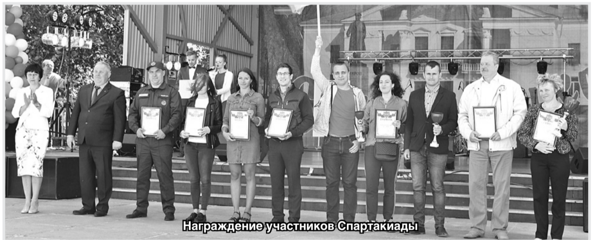
Награждение участников Спартакиады

Таким образом, команде Комитета образования хватило запаса очков, завоеванных в результате более