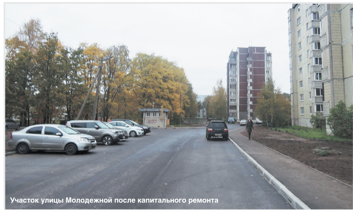
Участок улицы Молодежной после капитального ремонта