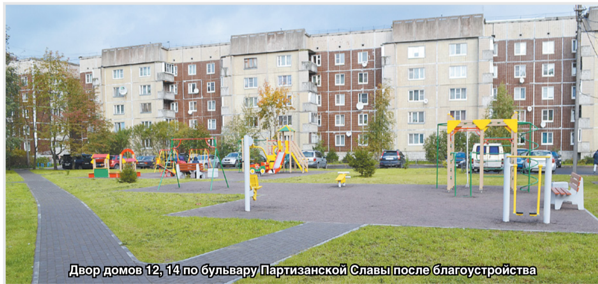
Двор домов 12, 14 по бульвару Партизанской Славы после благоустройства

— На мой взгляд, большинство жителей моего округа довольно моей работой. Но, конечно, я сталкиваюсь и с критикой. Такая обратная связь от населения важна и полезна для меня, она не дает расслабиться. Чаще всего критика оправдана, ведь кто, если не сам житель дома, знает свою проблему изнутри. Чтобы эффективно решать проблемные вопросы жителей округа, нужно их знать. Депутат должен отстаивать интересы своих избирателей не на словах, а на деле. Главный показатель моей работы — сам округ. Я регулярно бываю на проблемных точках округа и считаю, что за пять лет его территория изменилась в положительную сторону: асфальтовое покрытие на дорогах и тротуарах в удовлетвори-