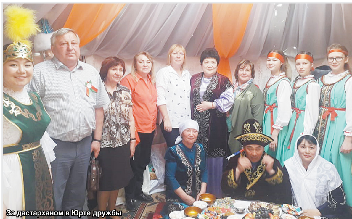
За дастарханом в Юрте дружбы