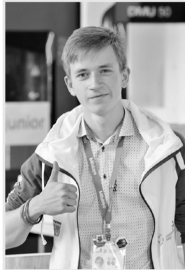
Фото из группы ВКонтакте «WorldSkills Russia | Ленинградская область»

По материалам пресс-службы губернатора и правительства Ленинградской области