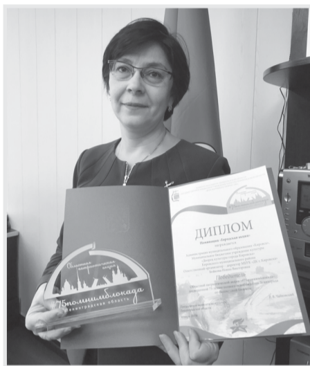
Администрация МО «Кировск» искренне поздравляет всех участников акции с заслуженной победой! Пресс-служба администрации МО «Кировск»

Напомним, что 26 января в Парке культуры и отдыха города Кировска состоялась акция, приуроченная к 75-летию полного освобождения Ленинграда от фашистской блокады, участниками которой стали более трехсот человек. В назначенное время люди выстроились в число 75. В мероприятии приняли участие жители всех возрастов — от самых маленьких и до жителей блокадного Ленинграда.