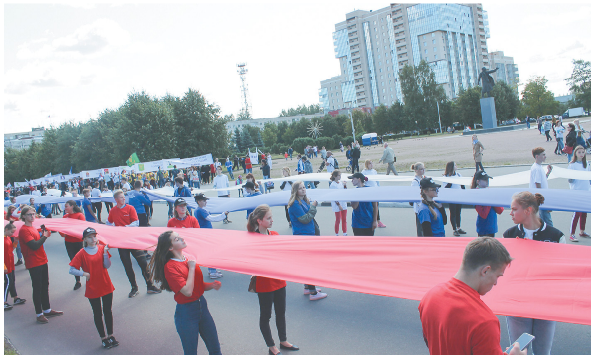
День флага, 2018