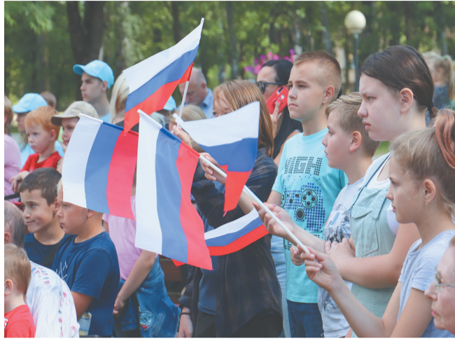
День флага 2020

Во всех странах во все времена существовали свои опознавательные знаки. Флаг — тоже знак. Это идентификатор страны. Как иначе определить своих, например, на соревнованиях или на встречах делегаций? Не зря же на любых заседаниях и трансляциях по ТВ мы интуитивно ищем изображение триколора: там — наши, там — свои. Это и есть общая идея, национальная гордость.