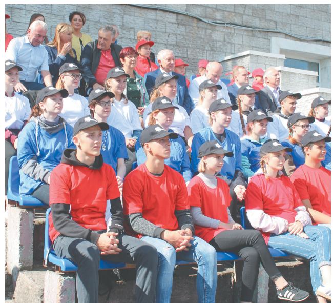
День флага 2018

граждан под единым флагом, с единым гимном, общими ценностями и т.д.