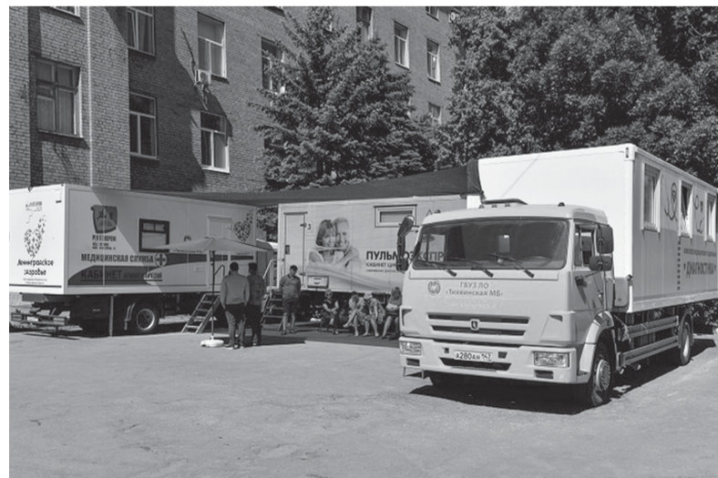
Материалы пресс-службы губернатора и правительства Ленинградской области

Решается вопрос о поставке в учреждения здравоохранения Енакиево медицинского оборудования. Ленинградские медики продолжают проводить диспансеризацию жителей подшефного нашему региону города. Восемь пациентов, педиатры из которых — дети, получают высокотехнологичную медицинскую помощь в Ленинградской областной клинической больнице и Областной детской клинической больнице.