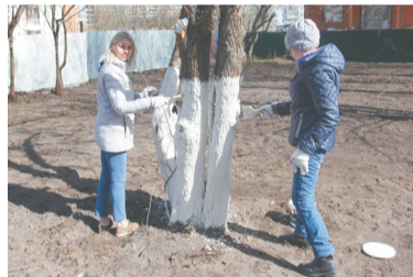
Сквер по ул. Новая, д. 20