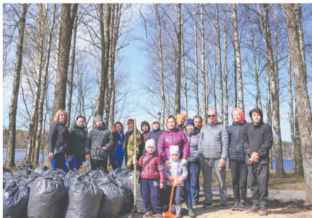
Сотрудники ГКУ Леноблпожспас