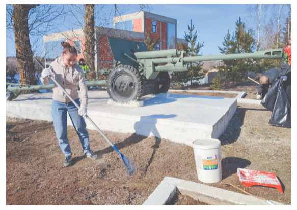
У памятника «Дивизионная пушка ЗИС-3»