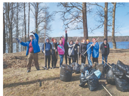
Молодежь города Кировска