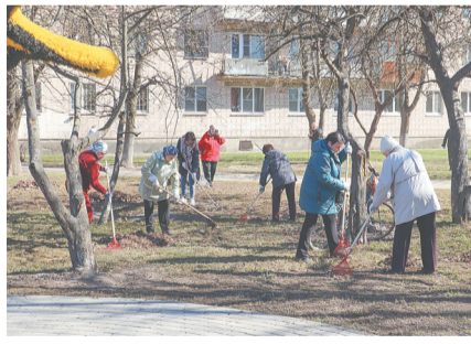
Совет ветеранов г.Кировска и п.Молодцово и ветераны ДК