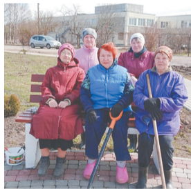
Активные участники субботника в п.Молодцово