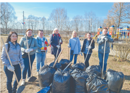
Уборка в Парке культуры и отдыха г.Кировска