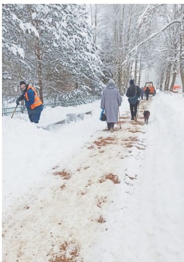
Тротуар ул. Краснофлотская