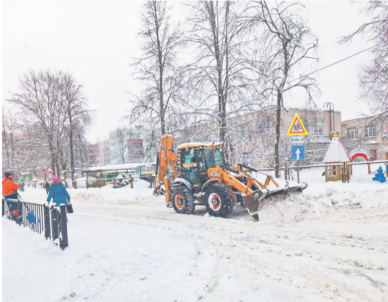
Вид на Церковь Усекновения главы Иоанна Предтечи