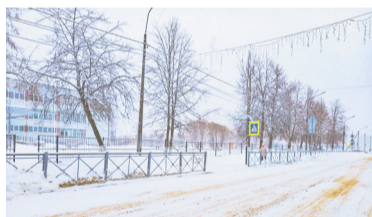
Ул. Новая, возле КСОШ № 1