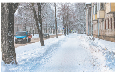
Тротуар ул. Советская