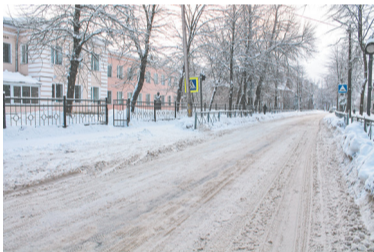
Ул. Горького, возле гимназии