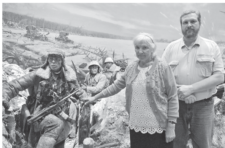
Дочь и внук героя на панораме, 2018 г.