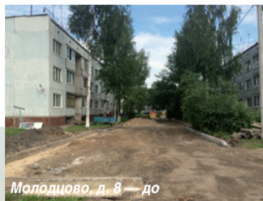
Молодцово, д. 8 — до