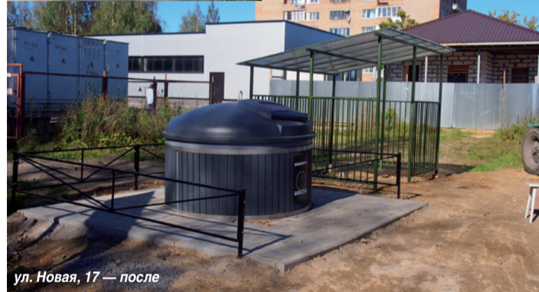
ул. Новая, 17 — после

правления на части территорий населенных пунктов Ленинградской области, являющихся административными центрами» были произведены работы: