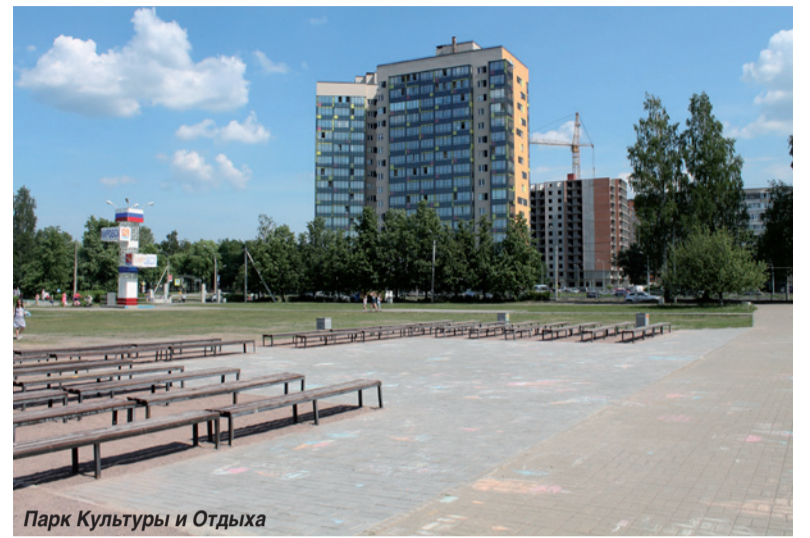
Парк Культуры и Отдыха