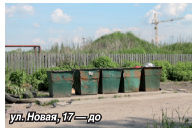
ул. Новая, 17 — до