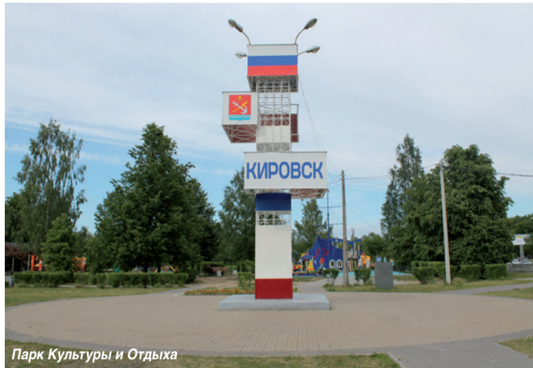
Парк Культуры и Отдыха

В рамках № 42 Областного закона «О содействии развитию иных форм местного самоуправ-