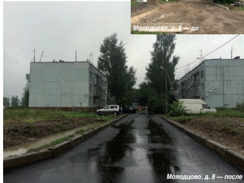
Молодцово, д. 8 — после