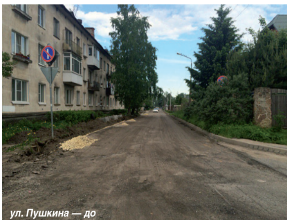
ул. Пушкина — до

Также были выполнены ремонтные работы по постаменту и прилегающей территории памятника С.М. Кирову на Театральной площади.