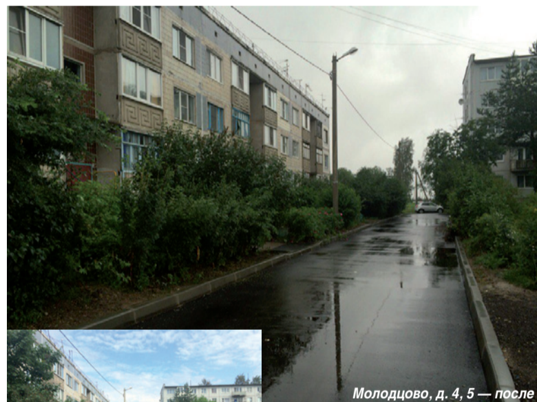
Молодцово, д. 4, 5 — после