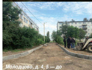
Молодцово, д. 4, 5 — до