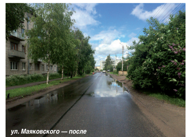
ул. Маяковского — после