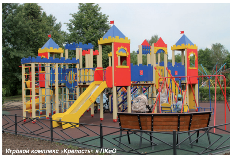
Игровой комплекс «Крепость» в ПККО

В 2016 году в рамках благоустройства Парка культуры и отдыха для малышей был построен еще один большой игровой комплекс в виде крепости.