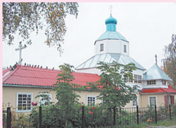
Молебен с акафистом Пресвятой Богородице Неупиваемая чаша -14ч.

19 февраля Неделя мясопустная, о Страшном Суде. Заговенья на мясо. Исповедь - 9ч. Часы – 9:40. Литургия - 10ч.