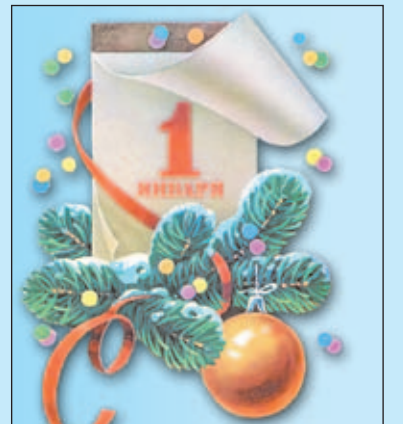
С НОВЫМ ГОДОМ! СТР. 4, 9