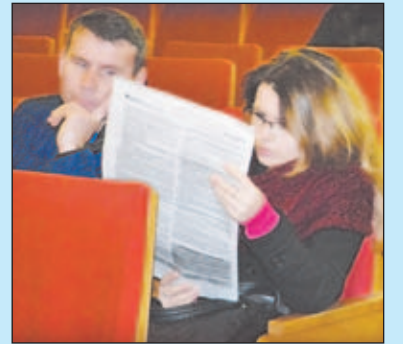
ГОРОД И ГОРОЖАНЕ СТР. 3