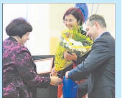
ДЕНЬ ЭНЕРГЕТИКА СТР. 12