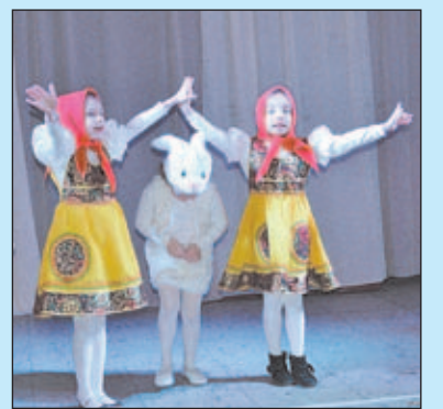
ИГРАЙ, ТЕАТР, ИГРАЙ СТР. 11