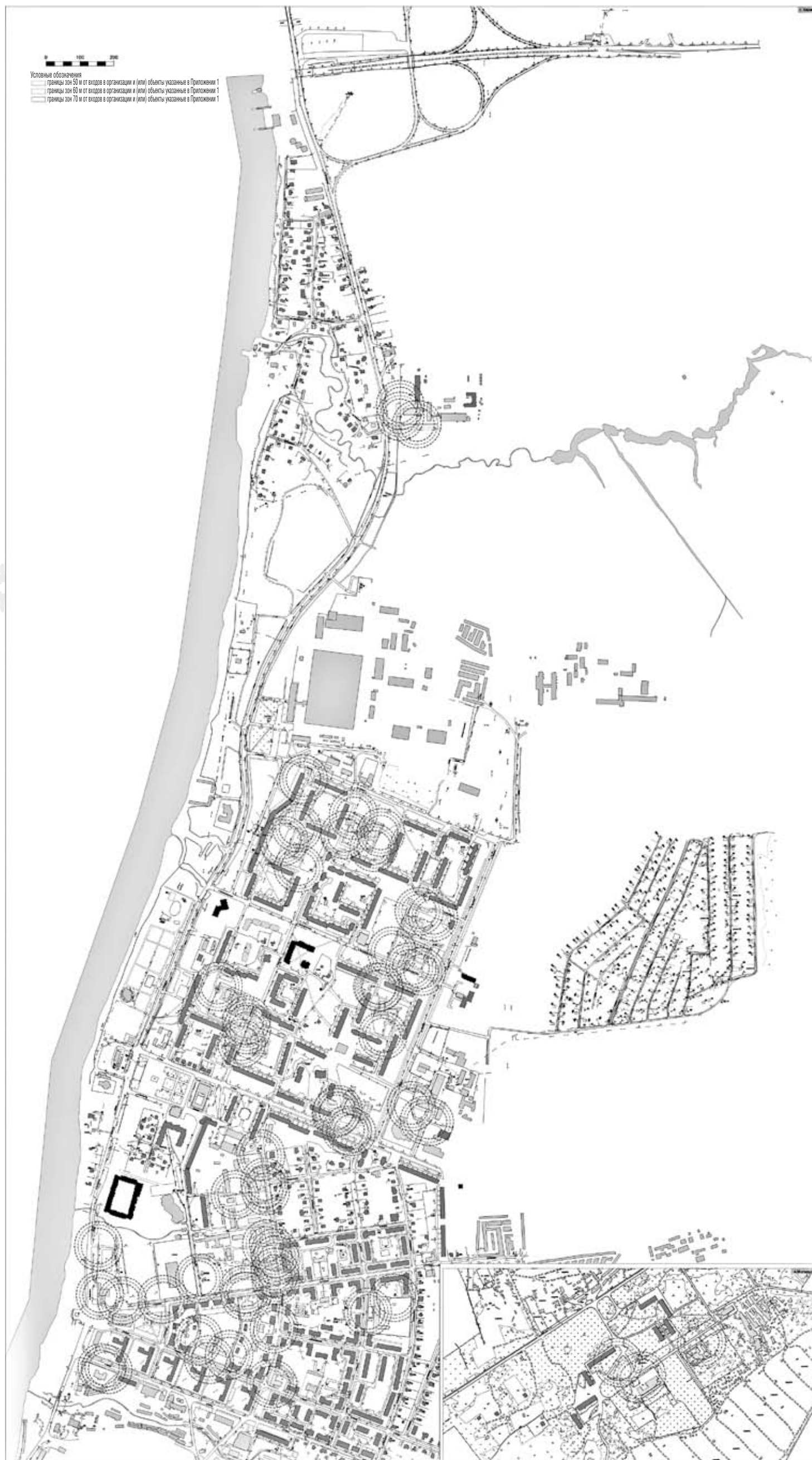
Схема границ прилегающих к детским, образовательным, медицинским организациям и объектам спорта территорий, на которых не допускается розничная продажа алкогольной продукции Ленинградская область, Кировский район, МО «Кировск»

Приложение №2 к решению совета депутатов МО «Кировск» от «18» декабря 2014 года № 62