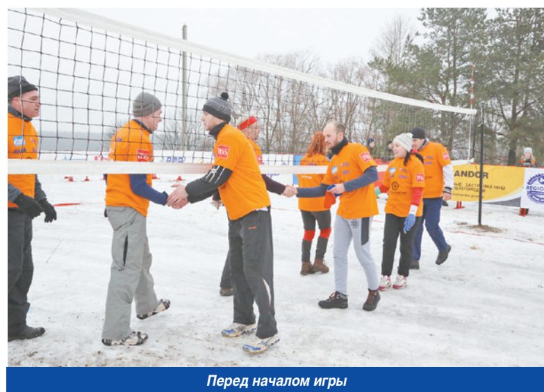
Перед началом игры

По сравнению с прошлым годом, погода на этот раз благоволила спортсменам. Не было снегопада и трескучего мороза, который не позволил бы играть без перчаток. А руки и пальцы — это основной инструмент волейболиста. Точность паса и удара напрямую зависит от того, насколько хорошо разработаны конечности. Однако потепление принесло свои неудобства — обледенели площадки. По правилам игры запрещалось использовать «кошки» и шипы на подошве. Многие волейболисты взяли с собой самую удобную обувь — зальные волейбольные кроссовки. Однако на такой поверхности они были совершенно бесполезны. Не обошлось без падений, однако к медикам никто из игроков не