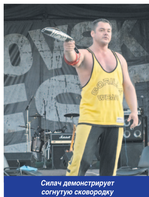
Силач демонстрирует согнутую сковородку