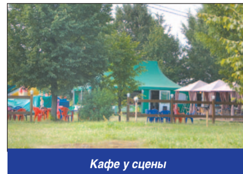
Кафе у сцены

знать «походные условия» или неорганизованность персонала. Вместо ожидаемой свежеприготовленной долмы принесли разогретую, чем очень огорчили. К шашлыку претензий нет. Место отлично подойдет для семейных посиделок, а красивый вид на Неву добавит романтики вашим свиданиям.