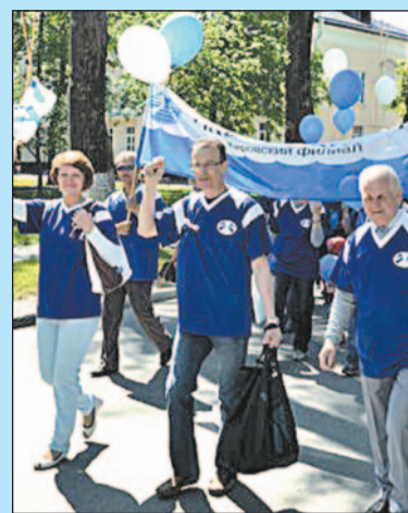
С ДНЕМ РОЖДЕНИЯ!