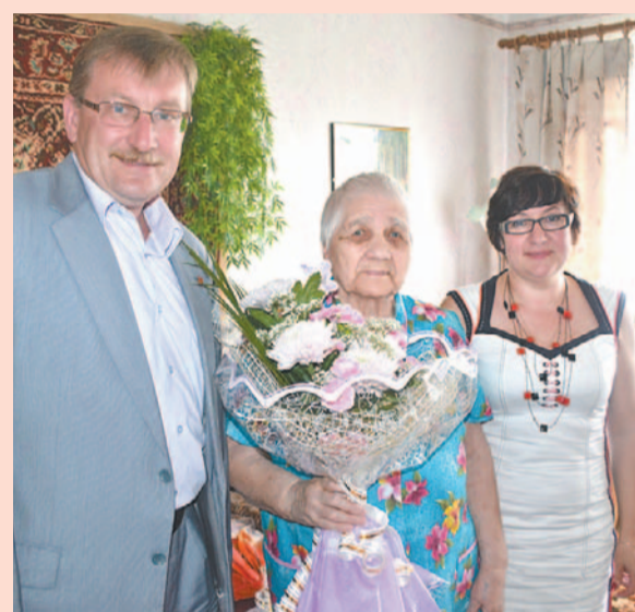
Пресс-служба администрации МО «Кировск»