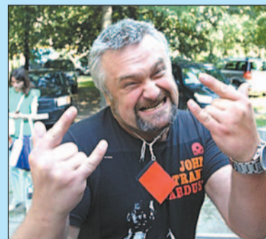
«НА КИРОВСКОЙ ВОЛНЕ»