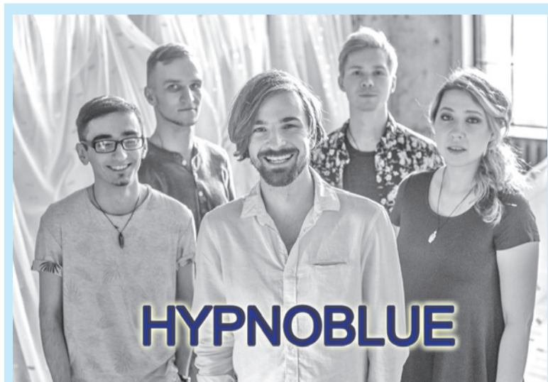
Одна из группа-дебютантов — московский коллектив Hyrnoblue, представляющий популярное направление indie rock.

— Добрый день! Если не ошибаюсь, вы участвуете в фестивале в первый раз. Почему вы выбрали именно KirovskFest?