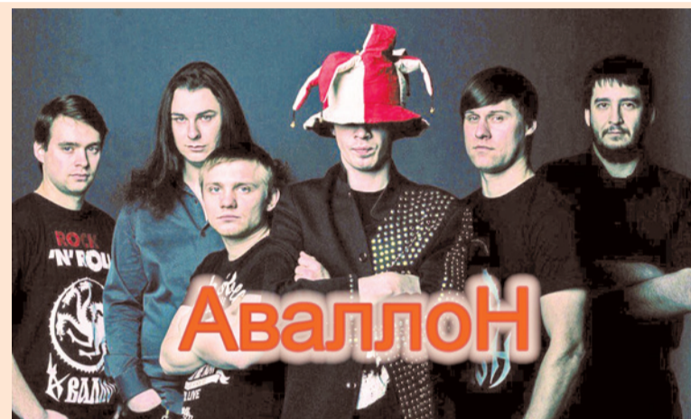
Ещё одна группа, которая впервые поднимется на кировскую сцену в этот фестивальный день, — «Аваллон» из города Тосно, играющая рок-музыку.

Но сейчас нам интереснее познакомиться с дебютантами, для которых это будет первый опыт шоу-выступлений на фестивале KirovskFest. Корреспондент газеты «Неделя нашего города» задал музыкантам несколько вопросов, касающихся их участия в кировском фестивале.