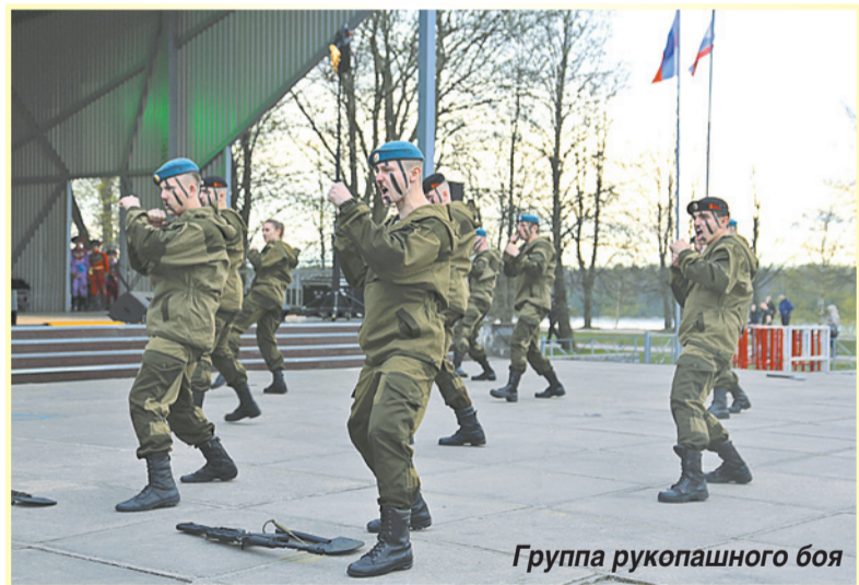
Группа рукопашного боя