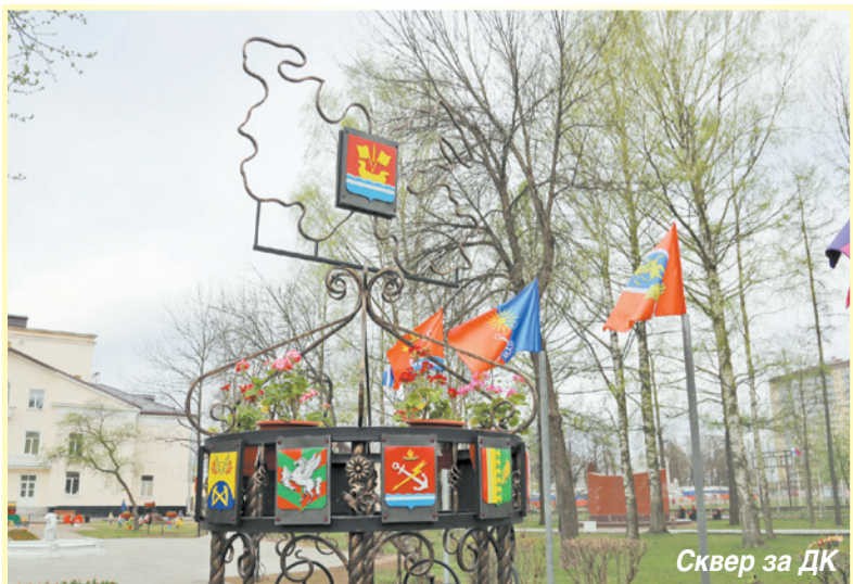
Сквер за ДК