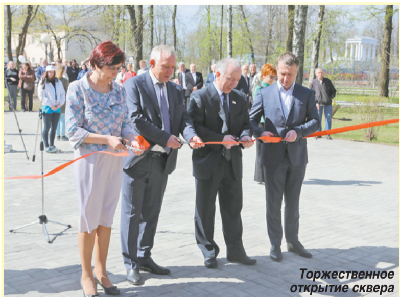
Торжественное открытие сквера