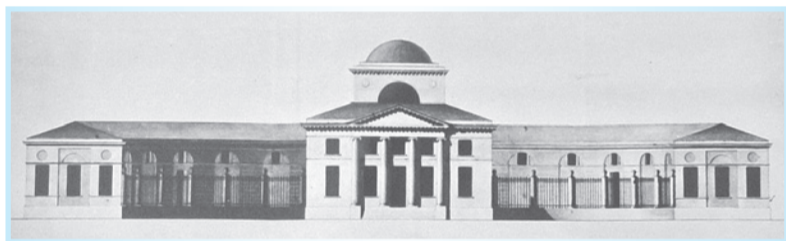
Н. А. Львов. Фасад почтовой станции в Пелле. 1785 год

По материалам Юрия Егорова и информации ОАО «Пелла»