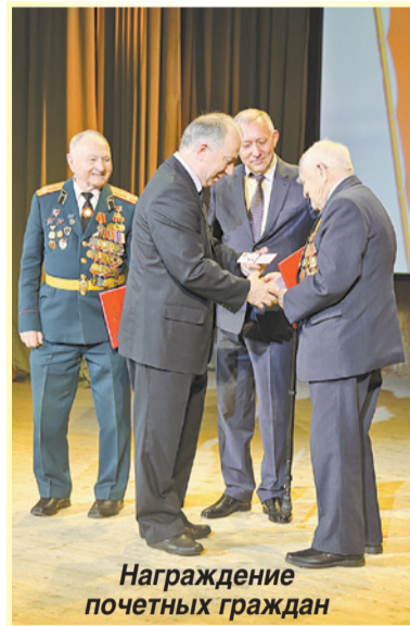
Награждение почетных граждан

После официальной части был торжественно открыт после реконструкции сквер за Дворцом культуры. Ранее безымянный зеленый «оазис» нашего города получил название «Сквер сорокалетия Кировского района». Символично, что в сквере установлены флаги всех муниципальных образований района, а также малая архитектурная форма, содержащая официальную символику муниципальных образований. На самой вершине