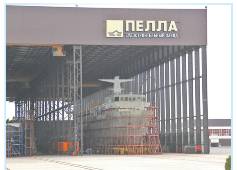
Новая площадка завода

В 1930-е годы на территории бывшей почтовой станции был построен завод автоприцепов Министерства лесной промышленности, где трудилось около двухсот колонистов, изготавливавших телеги на шинном ходу.