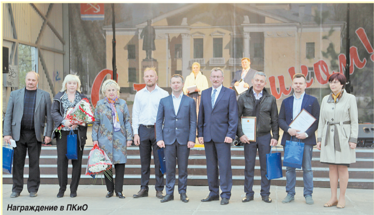
Награждение в ПКЮ