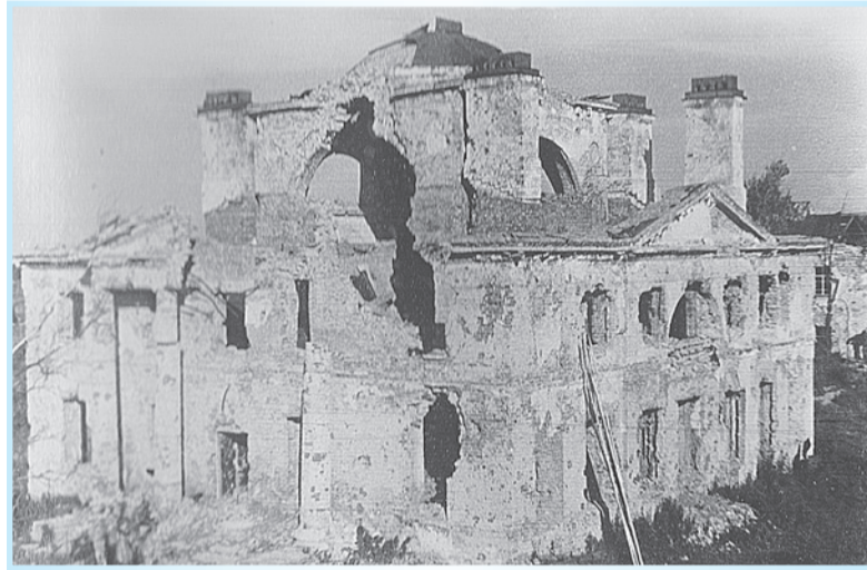
Главное здание бывшей почтовой станции в Пелле. Фотография 1946 года

История здешних мест также связана с историей декабристов. Для многих дворян, осужденных за участие в восстании 14 декабря 1825 года в Петербурге на Сенатской площади, длинная дорога из Петропавловской крепости на каторгу в Сибирь начиналась на Шлиссельбургском тракте, где на