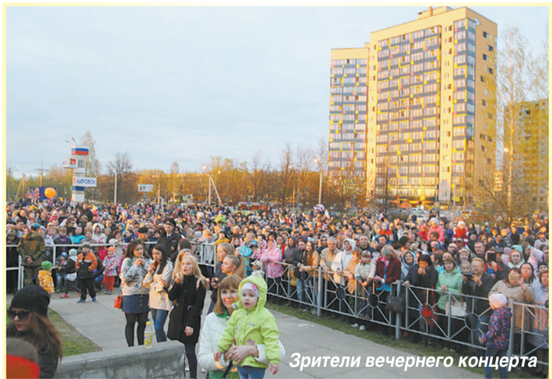
Зрители вечернего концерта