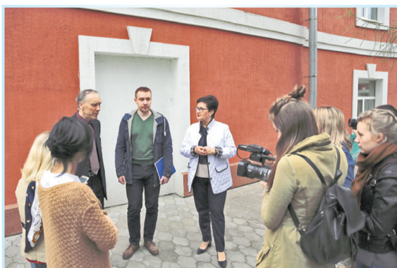
У административного корпуса

Из зданий ансамбля почтовой станции, находившихся на территории завода, восстановлены только служебные флигели и бывшее когда-то конюшенно-каретным дугообразное здание. В них разместились инженерно-конструкторские службы и заводоуправление. Главное же здание, разрушенное во время