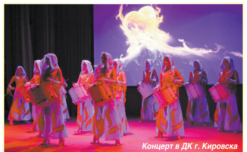
Концерт в ДК г. Кировска

Заявку на участие можно оставить в администрации МО «Кировск» каб. №232 или отправить по факсу 22-518., телефон для справок 23-325