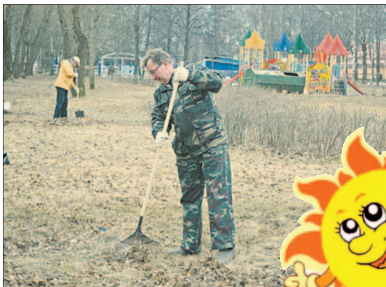
Фото: Е.Сухоносова «Уборка ПКЮ», А.Маврин «Уборка Краснофлотской»

Вместе работать – сподручней и веселей, тем более, что приводит город в порядок после зимы - традиция привычная, и почему-то верится, что после субботника Весна придет к нам уже окончательно и бесповоротно.