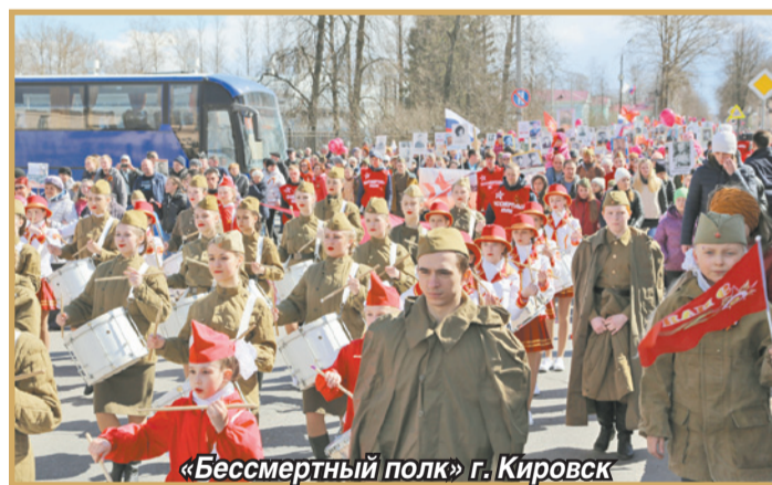
«Бессмертный полк» г. Кировск