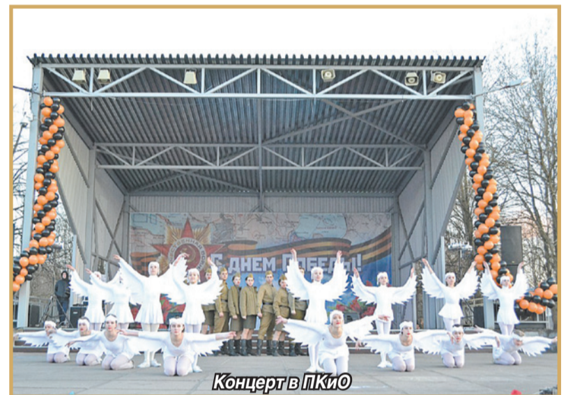
Концерт в ПККО

Традиционно многие жители нашего города отправились на мемориал "Синявинские высоты", почтить память павших солдат и принять участие в районных мероприятиях, посвященных дню Победы. На "Синявинских высотах" прошел общерайонный "Бессмертный полк" и митинг, в котором