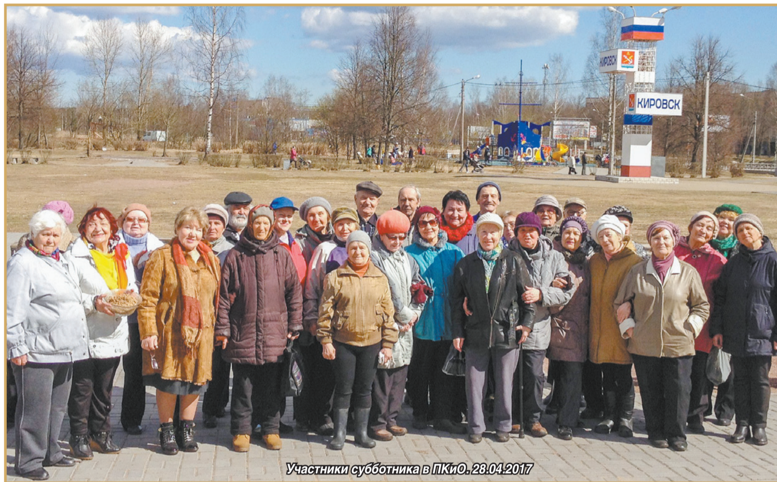
Участники субботника в ПККО. 28.04.2017