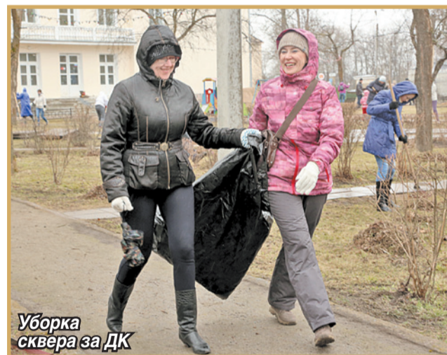
Уборка сквера за ДК