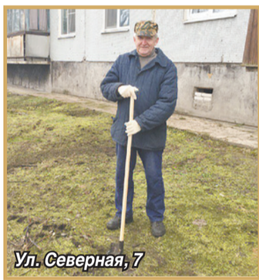
Ул. Северная, 7