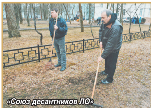
«Союз десантников ЛО»