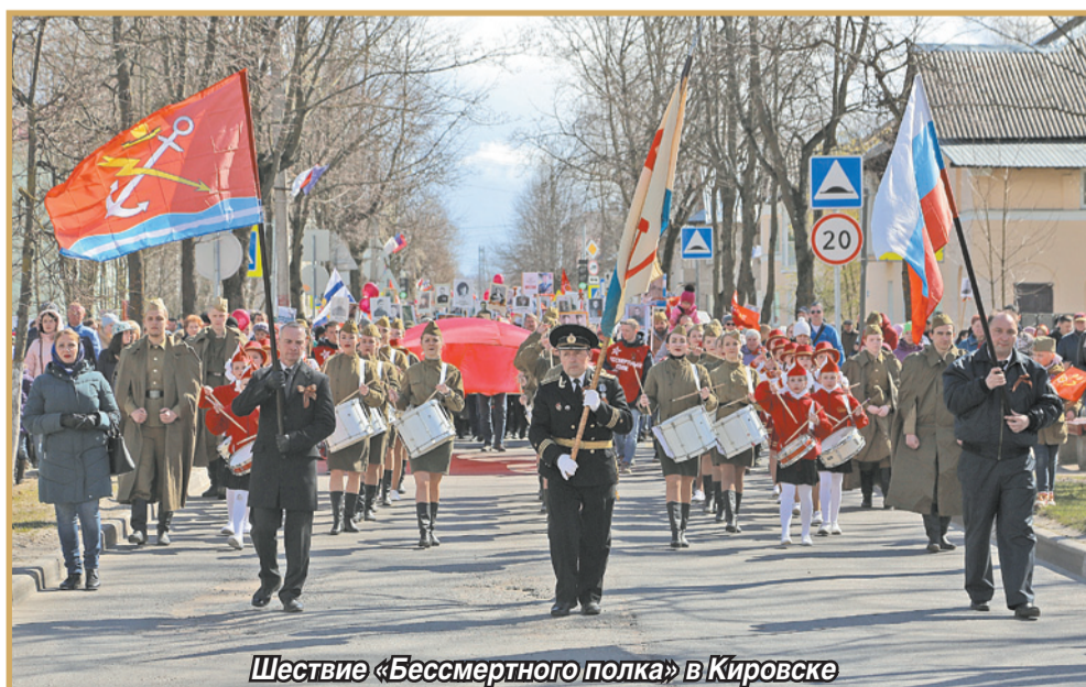
Шествие «Бессмертного полка» в Кировске