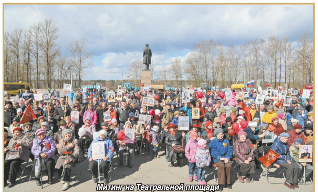
Митинг на Театральной площади