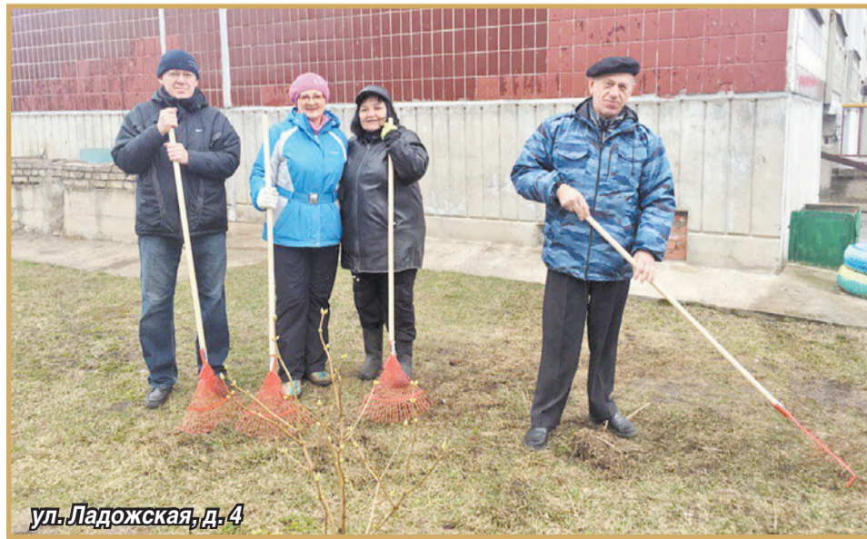
ул. Ладожская, д. 4