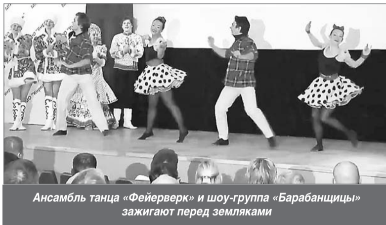
Ансамбль танца «Фейерверк» и шоу-группа «Барабанщицы» зажигают перед земляками

Антон Данилец