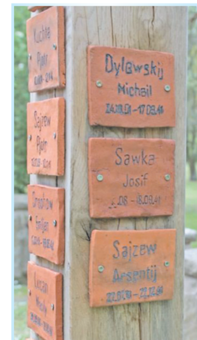
Глиняные таблички советским воинам создают немецкие школьники