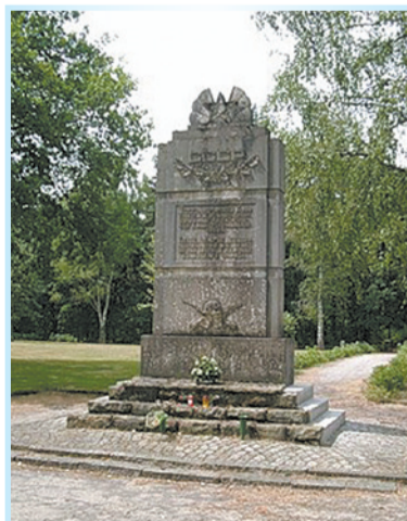
Памятник советским воинам на кладбище в Витцендорфе

Мой рассказ звучит в преддверие великого праздника — Дня Победы. Этот день почитают все, однако, даже через 72 года после окончания войны, многие семьи не знают подробностей гибели своих близких, в особенности тех, кто пропал без вести. Так, моя бабушка получила печальное известие об одном из трех своих сыновей. Государство платило ей небольшую пенсию за пропавшего сына, но оставалось подозрение о переходе его и других пропавших на сторону врага. По этой причине никому и в голову не приходило искать сведения об этих людях. Да и какие были для этого средства в послевоенные годы?