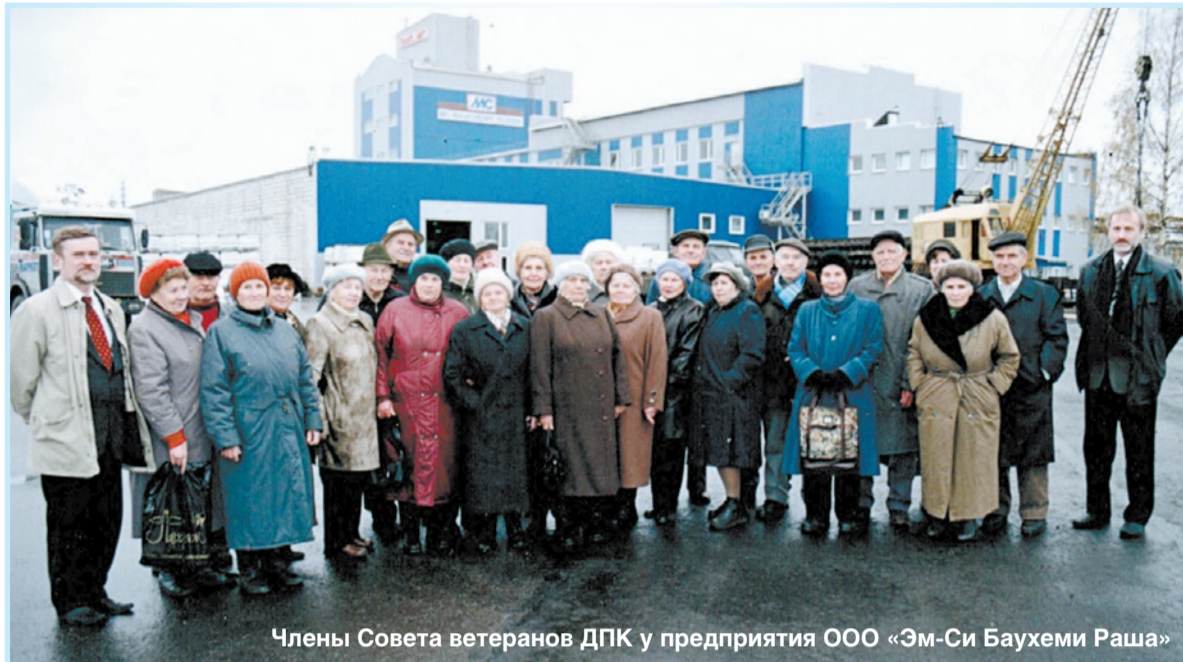
Члены Совета ветеранов ДПК у предприятия ООО «Эм-Си Баухеми Раша»

— Благодаря поддержке администрации района и Правительства Ленинградской области я успешно справился с решением поставленных задач. К концу 1997 года были погашены долги по зарплате, а к 1999-му ДПК вышел из процедуры банкротства и меня назначили генеральным директором. К тому времени на промплощадке уже