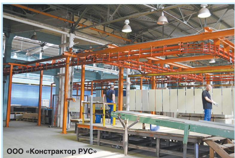
ООО «Конструктор РУС»

По материалам Елены Самсоновой, газета «Вести»